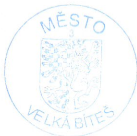
otisk úředního razítka