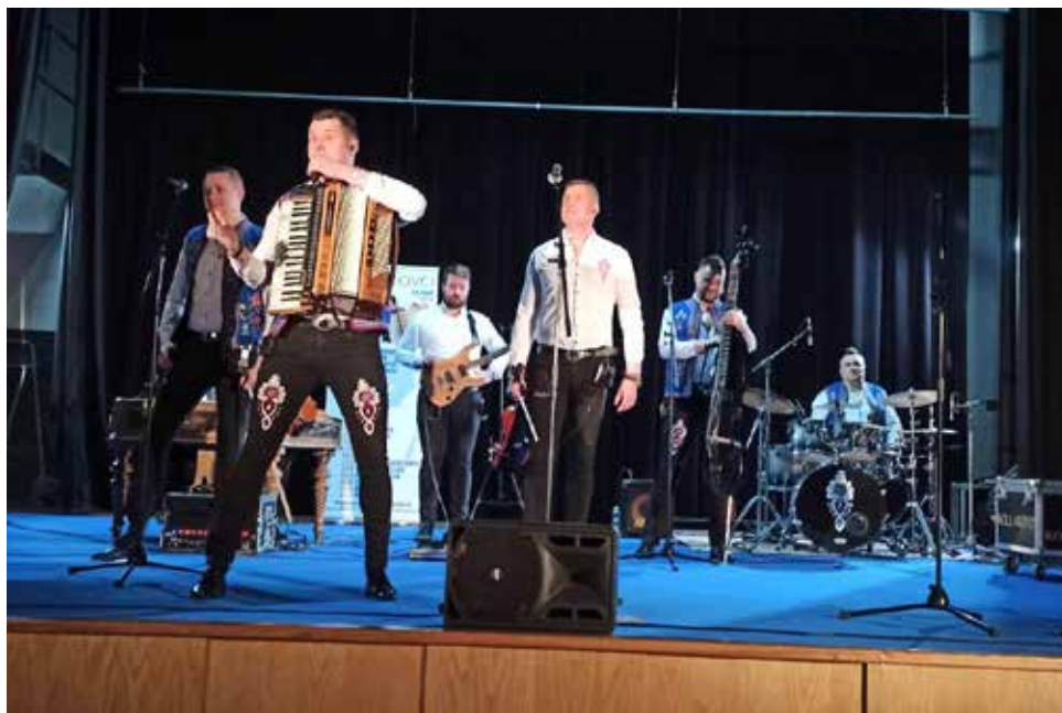
Z koncertu.

Jsme velmi rádi, že nás v rámci CZ Tour 2023 opět navštívila úžasná kapela Kollárovců z východního Slovenska. Velkou Bíteš kapela navštívila poprvé v roce 2019. Tato sympatická kapela svým temperamentním zpěvem, humorným slovem a hromadou goralské temperamentní energie vytvořila v zaplněném sále kulturního domu v pátek 3. března nezapomenutelnou atmosféru. Po celou délku koncertu skoro dvouhodinového koncertu bylo u diváků vidět velké nadšení, úsměv na tváři, dobrá nálada, zpěv, ale i tanec. Pozitivní nálada se nesla celým sálem.