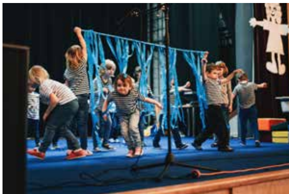
Vystoupení na schůzi SPCCCH.

V půlce března nás navštívila ortoptistka Bc. Veronika Kroulíková , která přihlášeným dětem provedla screeningové vyšetření zraku.