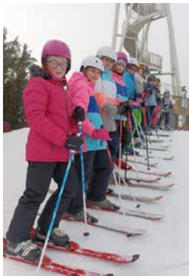
Lyžařský výcvik.

V týdnu od 13. do 17. února se někteří žáci pátého a sedmého ročníku účastnili lyžařského výcvikového kurzu na sjezdovce nad Velkým Meziříčím – na Fajtově kopci. Družstvo zkušenějších lyžařů začalo ihned zdokonalovat svoje sjezdařské dovednosti na velkém kopci. Dvě družstva nelyžařů začala od začátku lyžařskou abecedou – nejprve na mírně nakloněné rovince, později na dvou menších vlecích v horní části sjezdovky. Poté, co si začátečníci natrénovali nástup a výstup z vleku, opatrně sjíždění v pluhu, velké oblouky a bezpečné zastavení, odhodlali se také sjíždět velký kopec.