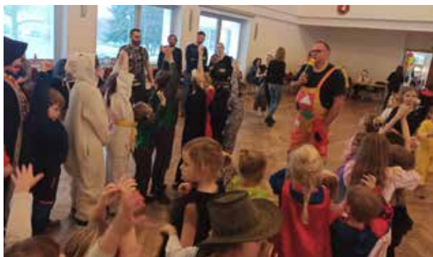
Z karnevalu.

a masek, ve kterých jsme mohli vidět např. Červenou karkulku, piráty, rytíře, indiány, čaroděje, Batmana, policistku, hasiče a nespočet princezen. Pro malé návštěvníky byla připravena bohatá tombola. Děti v ní mohly vyhrát nejen různé sladkosti, ale i hračky nebo knížky.