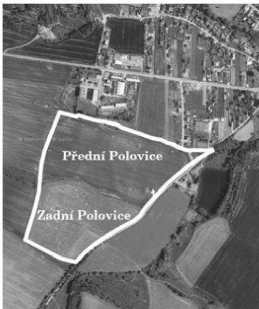
Vymezení josefinské tratě „Na Polovicích“ na satelitním snímku z roku 2021. Do snímku www.mapy.cz zakreslil autor.

Terziánský katastr z roku 1749 uvádí role „Polovica“. Městské gruntovní knihy 17. a 18. století rozlišovaly vícero podobných názvů. Ve zkrácené verzi „Na Polovicích“ (1667, 1671 – svobodná role s ouvarem, 1776–1800) nebo „V Polovicích“ (1682 – svobodná role s ouvarem). Táž svobodná role, která byla předmětem transakce roku 1682, se v roce 1655 nacházela „Na Prostředních nivách“. Podobně „V Prostředních nivách“ ležela role s ouvarem „mezi žlíbky“ (1597) či role „pod nebštychskými hrabčícími rolími“ (1629), případně byla prodána polovina role s ouvarem „V Prostředních nivách svobodných“ (1698) či polovina svobodné role též s ouvarem (1701). „Na Prostředních Polovicích“ se nacházela „za Furtem“ role (1725, 1732) či role s ouvarem (1741) nebo svobodná role (1775, č. 18) (7). „V Prostředních