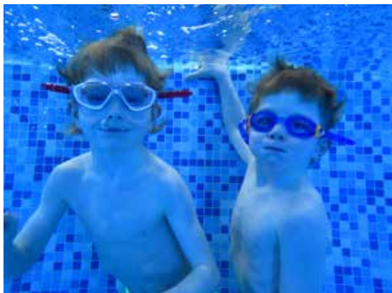
Plavecký pobyt.

Žáci ZŠ Lípa tak udělali první velký krok pro radostné a bezpečné léto u vody.