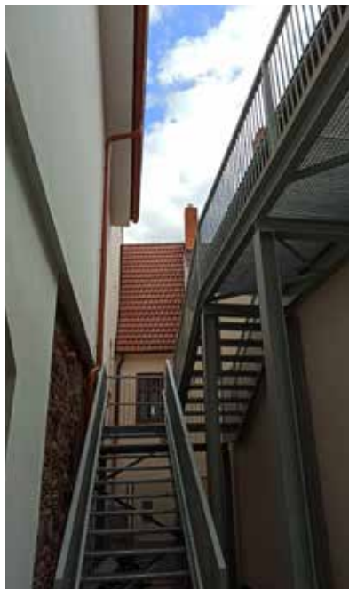
Kde se nachází schody, vyobrazené na fotografii?

Je tu další hádanka z okolí Velké Bíteše. Napište nám na e-mailovou adresu program@bitessko.com nebo na tel. č. 607 007 620 správnou odpověď na otázku, kde se místo zobrazené na fotografii nachází. Uzávěrka odpovědí je 15. 4. Vylosujeme a odměníme dva z vás se správnou odpovědí. Tu všem čtenářům prozradíme v následujícím čísle Zpravodaje města Velké Bíteše.