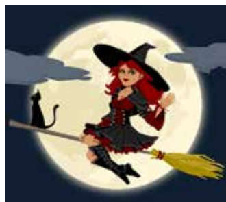
Čarodějnické dílny.

můžete si už v úterý 25. dubna přijít vybrat knížky s čarodějnickou tematikou a pustit se do příběhů, které vás s dětmi zavedou do kouzelného světa, kde spravedlnost zvítězí a nadpřirozené bytosti se s lidmi přátelí. Připravena je i řada her a úkolů pro děti, vyrobíte si čarodějnici nebo její pomocnici, černou kočičku. Vyrábění bude dostatek, aby si vybraly všechny děti. Dopolední dílničky jsou vhodné spíše pro malé děti a maminky či rodiče na mateřské, odpolední program je variabilní pro různě staré děti.