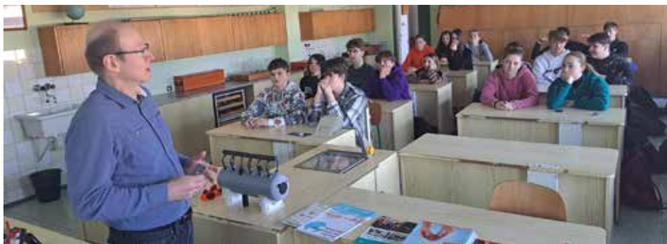
Exkurze do VO Dalešice.

Dokážou lidé žít bez energie? Jak mít dostatek energie, a přitom si nezničit planetu? Kolik energie se spotřebuje v domácnosti? Jaké energetické zdroje člověk využívá? Dá se energie nějakým způsobem uchovat? Proč se lidé bojí radioaktivity?