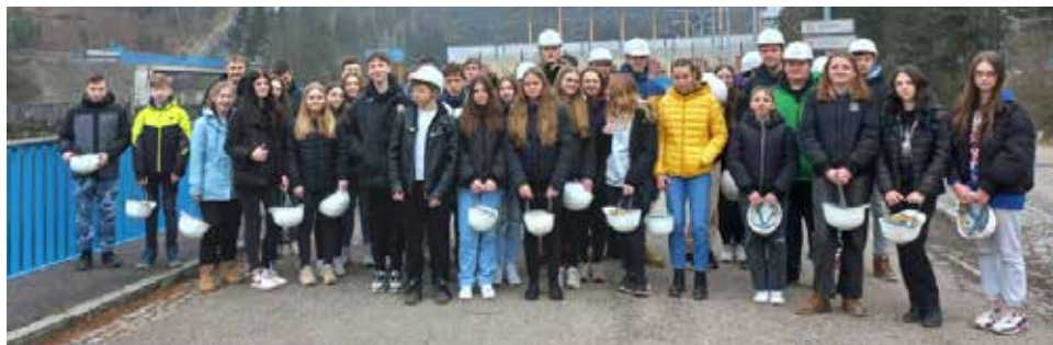
Beseda o energii.

V pátek 17. února se žáci devátých ročníků vydali na exkurzi do přečerpávací vodní elektrárny Dalešice a jaderné elektrárny Dukovany. Nejdříve navštívili vodní dílo Dalešice. Prohlédli si hráz, podívali se do strojovny a na „Velín“, odkud se elektrárna řídí.