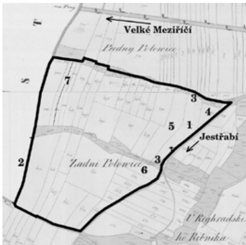
Trať „Na Polovicích“ dle josefinského katastru z 18. století. Do mapy stabilního katastru z roku 1825 zakreslil autor.

blíž rybníka Rejhradského“. Následně byla role jmenována jako „Čermákovská“ (1694) podle zmíněného Pivoňky, který své druhé příjmi Čermák vyženil nejspíše roku 1637, kdy mu byl připsán právovárečný dům po ševci Lukáši Čermákovi (čp. 10). Obec roli „na Polovicích u Rejhradského“ o výsevu 5 měřic či výměře pod 1 jitro 850 4/6 sáhů (0,88 ha) prodala v dražbě roku 1790 dvěma sousedům za cenu 75 zlatých rýnských. Dále se v trati dle josefinského katastru nacházela loučka na dvou místech (č. 4) „u obecní roli“, čili na obou koncích zmíněné role (3). Role „na klínku“ se nazývala podle svého tvaru (č. 1) (4). Tato role „klínek nad cestou jestřabskou“ byla předmětem prodeje roku 1694 (7 zlatých rýnských). Samotná trať byla dělena na dvě části. „Na Předních Polovicích“ byla uvozena rolí č. 5 (5) a „Na Zadních Polovicích“ rolí č. 23 (6).