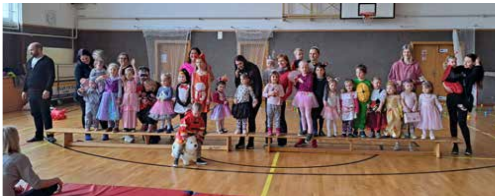
Společné foto.

I my ve Cvičení rodičů s dětmi jsme se přidaly ke karnevalové sezóně a 7. 3. 2023 jsme uspořádaly netradiční hodinu s maskami a soutěžemi. Masky si zahrály na modely a modelky a promenádu na mole si moc užili. Všichni odcházeli s odměnou a dobrou náladou. Děkujeme za Vaši přízeň a školákům za pomoc.