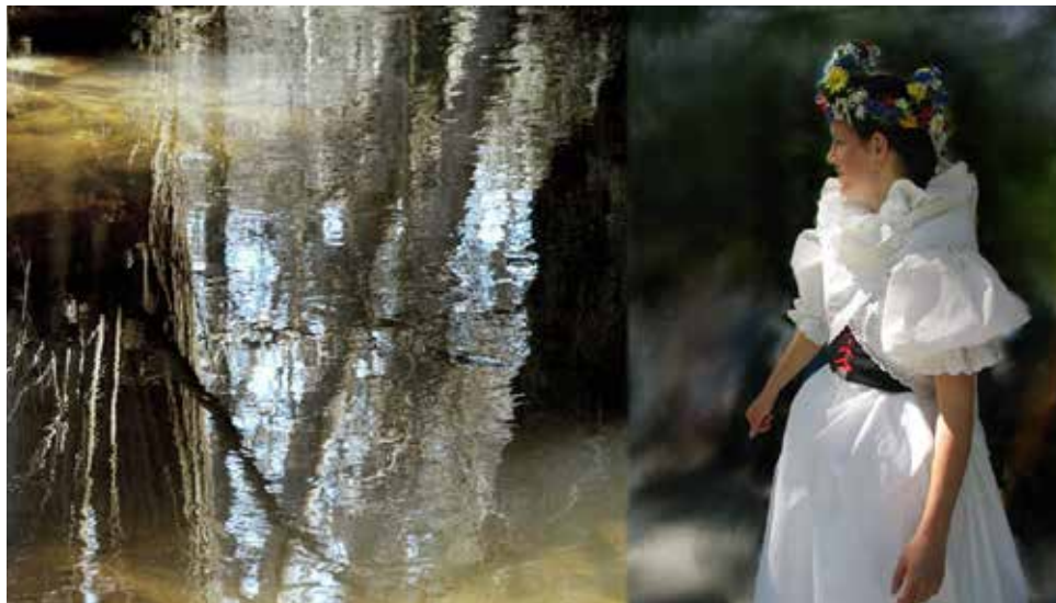
Královna z roku 2004, Jestřabí.

obyčejí občůzkového koledního rázu spojeného se zpěvem a tancem, který na Velkobítešsku v čase Letnic každoročně ožívá, promluví Silva Smutná z Regionálního pracoviště tradiční lidové kultury v Kraji Vysočina při Muzeu Vysočiny Třebíč. Slovní výklad doprovodí obrazovým a filmovým materiálem.