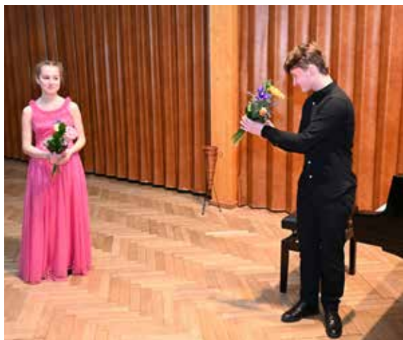
Z koncertu.

než sto nadšených posluchačů a rovněž účast dětského publika byla taková, že by nám ji mohli leckde závidět.