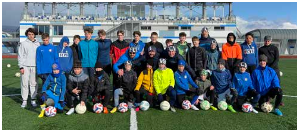
Společné foto ze soustředění.

V měsíci březnu odcestovali mladší a starší žáci místního fotbalového klubu FC PBS Velká Bíteš na fotbalové soustředění do Vrchlabí. Ve velmi pěkném fotbalovém prostředí na naše borce čekala skvěle připravená hrací plocha s umělým travnatým povrchem, na které jsme denně dvoufázově trénovali. Třetí den soustředění nás sice zaskočila sněhová nadílka, ale alternativní sněhový trénink na přilehlých loukách přinesl nejen kýženou tréninkovou porci, ale i spoustu zábavy. Po tvrdě odtrénovaném čtyřdenním soustředění čekala na hráče odměna v podobě relaxu v Aquaparku. Soustředění, které mělo zejména stmelit kolektiv a zvýšit kondici našich hráčů, dopadlo ku spokojenosti všech na výbornou. Je třeba říci, že v jarní sezóně, kdy hrajeme v KP v první šestce o celkového vítěze, bude určitě zúročeno. Poděkování patří všem hráčům, trenérům, rodičům a za podporu Svatebnímu salónu INA a firmě Kovoflex Velká Bíteš.