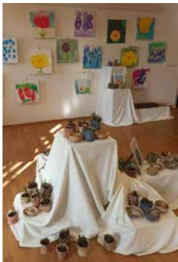
Z výstavy.