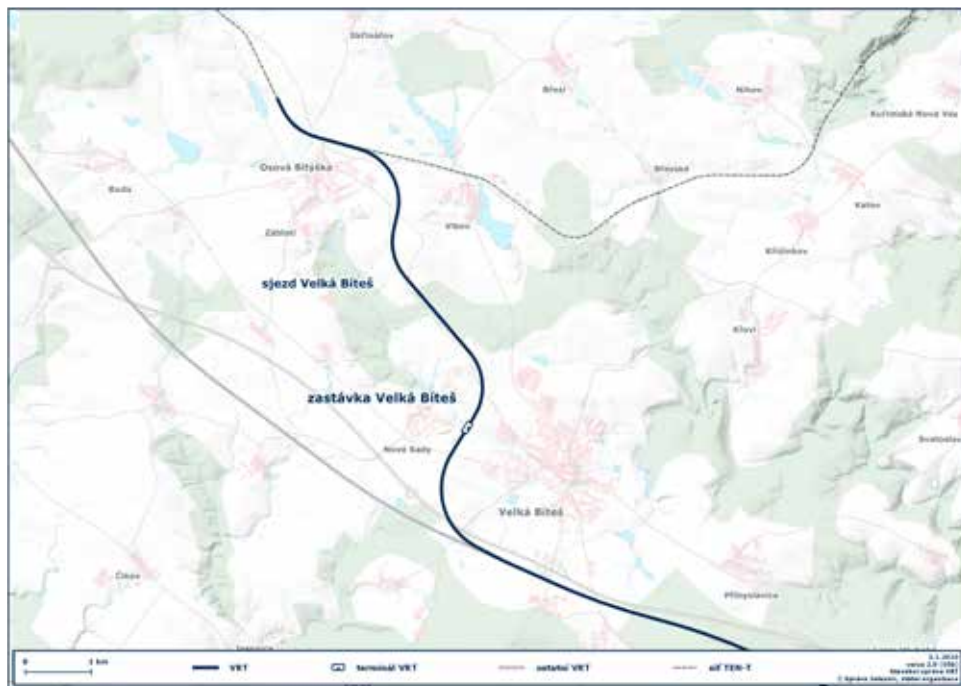
Mapka vysokorychlostní trati.

budou jezdit nižší rychlostí, než jaká bude obvyklá na vysokorychlostní trati (320 km/h), předpokládá se rychlost 120 km/h. Z technického hlediska je spojení také důležité pro zajištění spolehlivého provozu vysokorychlostních vlaků (v případě poruchy nebo zablokování hlavní trasy Praha-Brno).