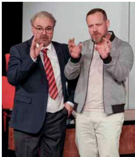
Z představení.

Má totiž obrovské svůdcovské schopnosti a nikdy mu žádná neodolala. Gregorio mu úvěr nedal, ale raději zavolal své manželce, aby si dala na Antonia pozor. Jeho žena se rozčílila, že ji takhle ohrožuje kvůli nějakému směšnému úvěru a nekompromisně ho vyhodila z domu. Gregorio chtěl svou ženu zpět, ale nevěděl, jak to udělat. Aby svou ženu opět okouznil, musel by mít nějaké svůdcovské schopnosti, ty ale nikdy neměl. A tak musel chtít nechtě požádat o pomoc zkušeného svůdníka Antonia. Pomohl Antonio svést zoufalému Gregoriově jeho ženu? A dostal požadovaný úvěr? A kdo nad kým nakonec zvítězil? To ví pouze návštěvníci představení, kteří se na humorné představení přišli podívat.