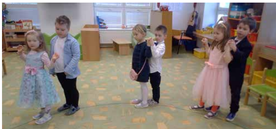
Beruškový ples.