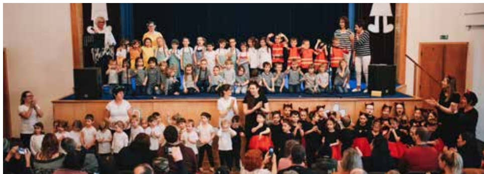
Akademie Veselé školky.

Největší událostí pro nás všechny byla Akademie Veselé školky . Ta se uskutečnila ve středu 8. března. Tématem letošní akademie bylo „I když jsme jen malé děti, tohle všechno umíme“. Vystoupily děti ze všech barevných tříd, národopisného kroužku Bítešánek