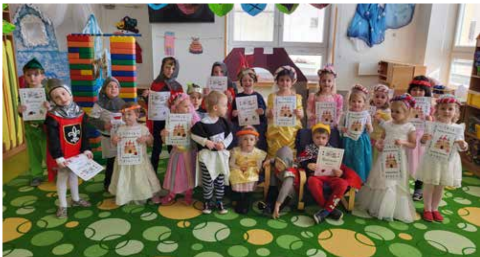
Hradní slavnost, Sluníčka.

Měsíc březen je měsícem knihy. Při této příležitosti jsme navštívili místní knihovnu , kde si pro nás paní knihovnice připravily poutavý program. Nejdříve si všichni poslechli pohádku o chlapci Adamovi a neposlušném větru. Příběh pojednával o tom, jak vznikla první kniha a byl doplněn různými obrázky a hrou na foukanou. Následoval společný úkol, kdy mladší děti vyhledávaly obrázky a starší děti slova nebo i samostatná písmena a vkládaly je podle tématu do obrázkových příběhů. Po splnění úkolu měly všechny děti možnost