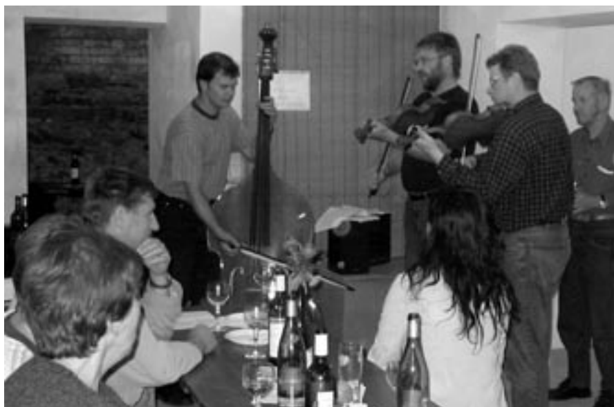
Bítešská houslová muzika ve sklípku U Fortny