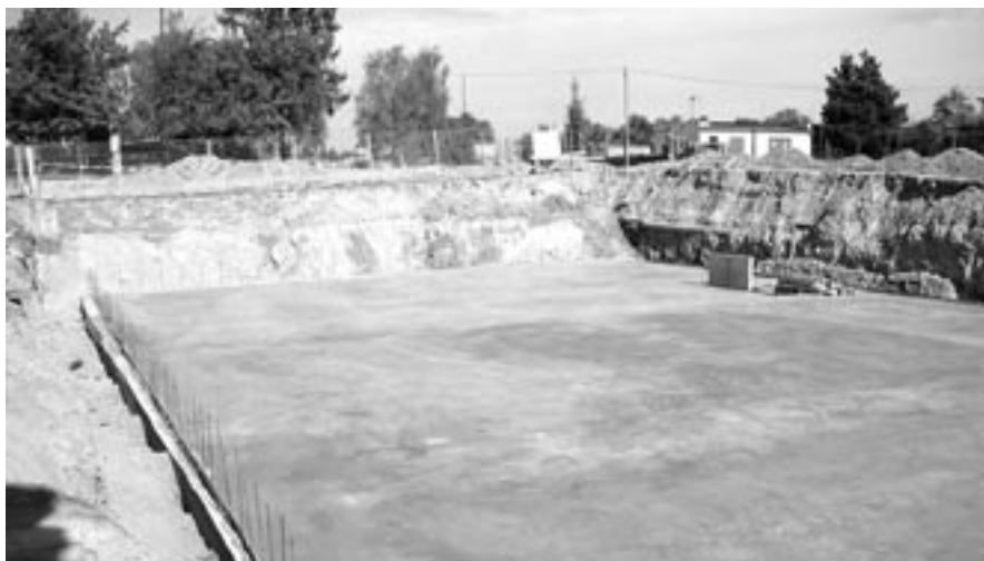
Pohled na dokončenou základovou desku