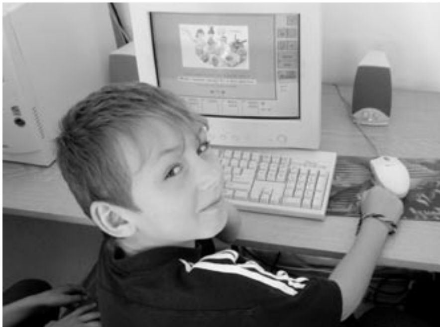
Práce s počítačem