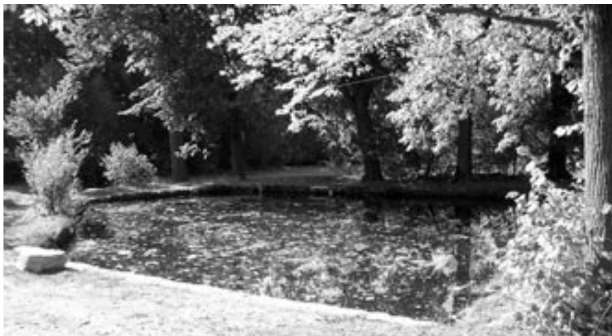
Jako tip na nedělní odpolední výlet mohu jen doporučit

V místní části Jestřabí realizovala firma AQUEKO odtěžení nánosů (lidově bahna) z místního rybníka. Počasí během měsíce srpna umožnilo místním rekonstruovat jednu stranu kamenného břehu a vybudovat nový přeliv s úpravou terénu v okolí rybníka. Poděkování patří všem, kteří se podíleli ve svém volnu na rozsáhlé opravě rybníka.