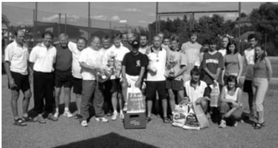
Účastníci 17. ročníku Městského přeboru 2004