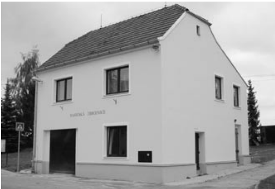
Pohled na dokončenou rekonstrukci domu