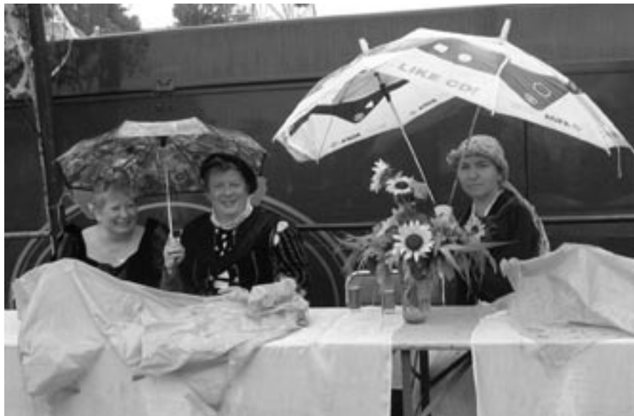
U rychtářského stolu...