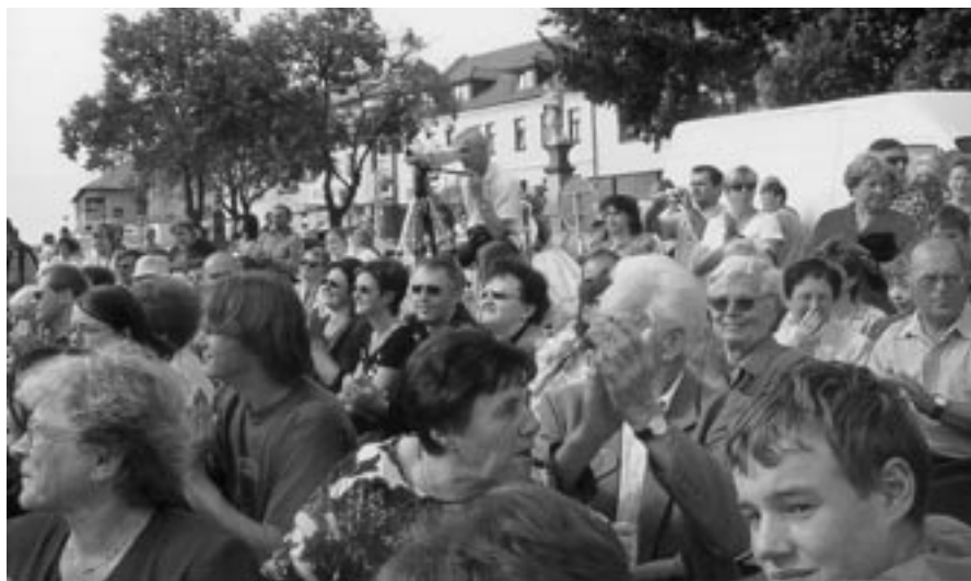
Pohled na část hlediště se spokojenými diváky