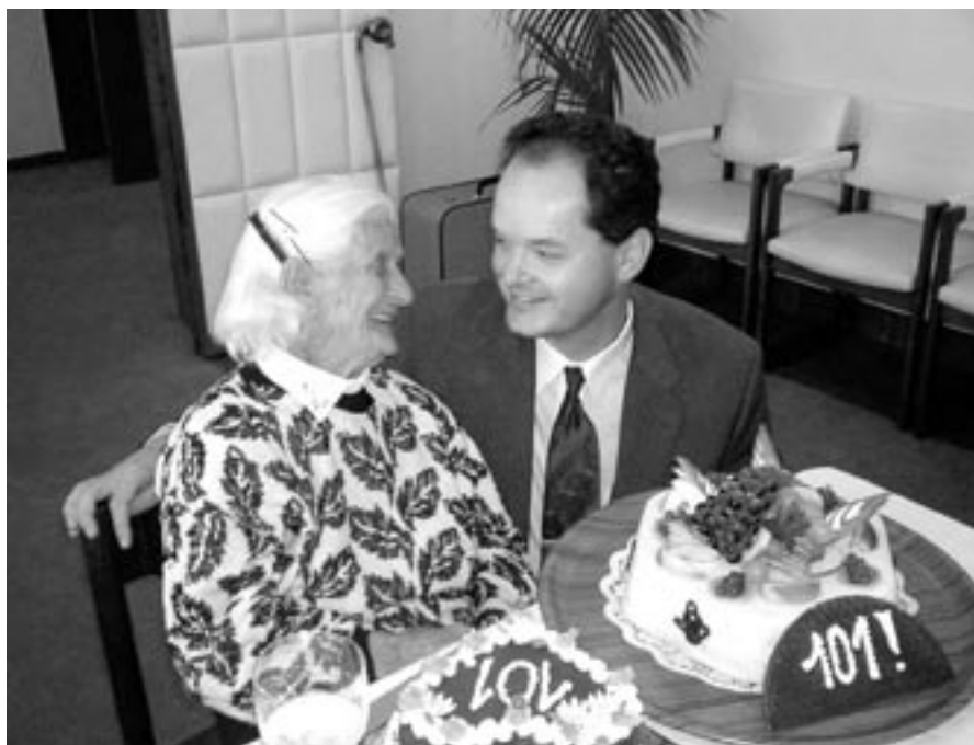
Fanda s panem starostou