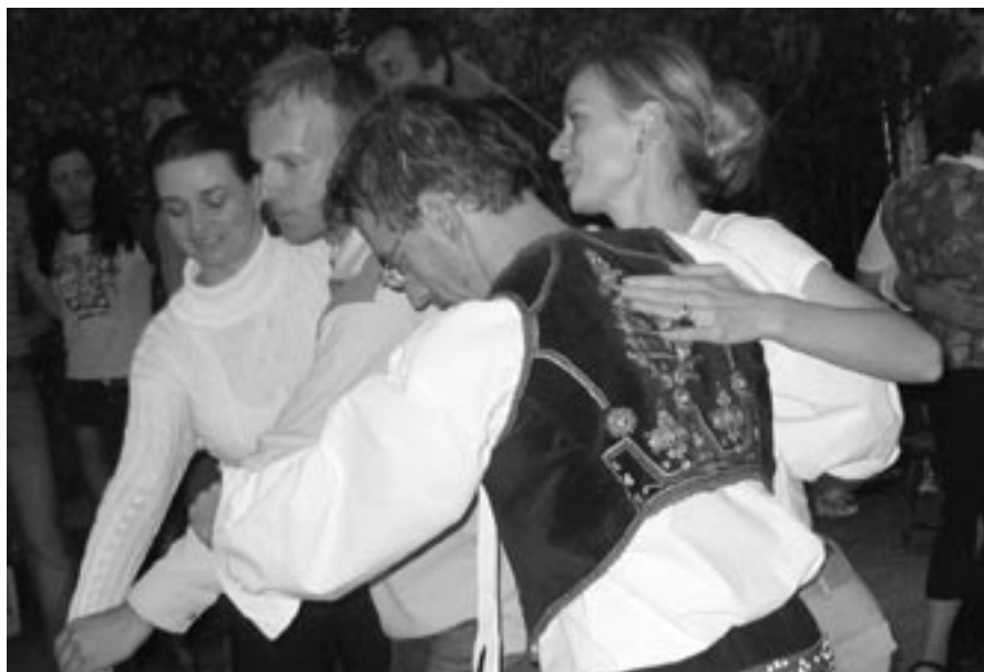
Hornácká cimbálová muzika nenechávala tanečníky zahálet