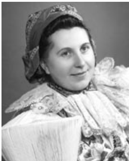
Ve vlčnovském kroji, asi 1937