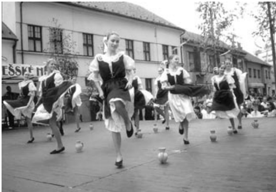
Hosté - dívky ze souboru „Setas“ ze Slovenského Sence