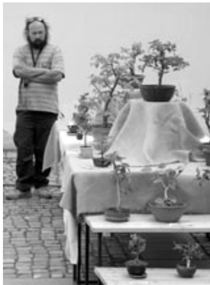
Z výstavy bonsají Hody 2004 v atriu ZUŠ ve Velké Bíteši