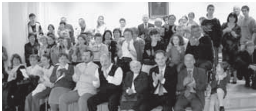
Návštěvníci koncertu na ZUŠ.