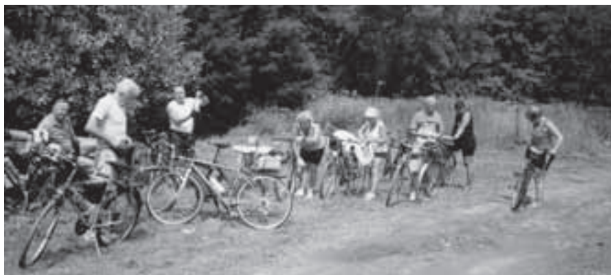
Zastavení u řeky Loučky před obcí Skryje.