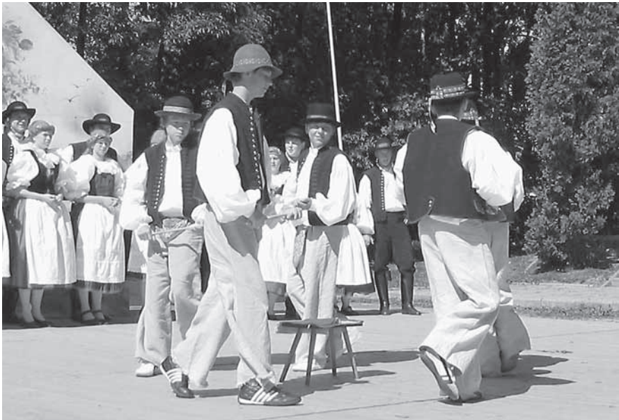
Mládenci z Bítešanu při „Vařečkové“ na festivalu v Kořenci 2005.