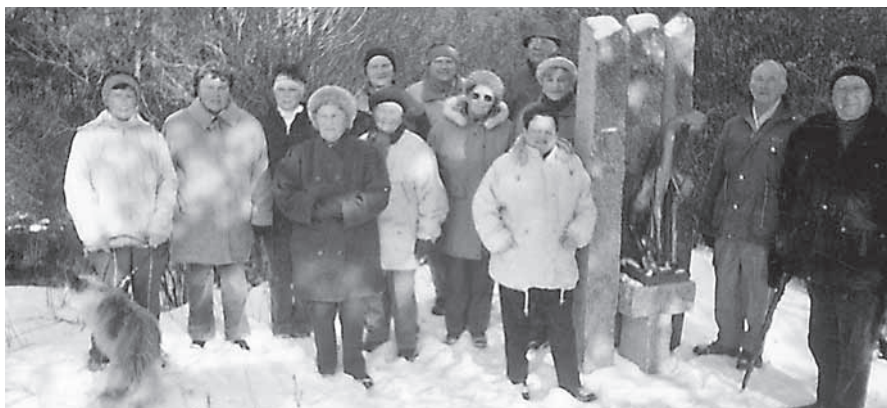
Vzpomínka na loňskou zimní vycházku k pomníčku v Radostínech.