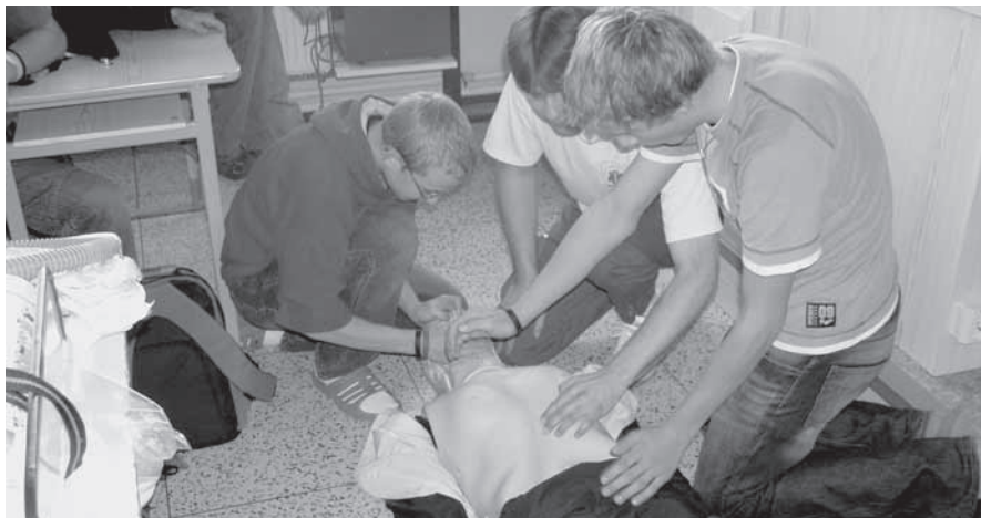
Resuscitace je součástí výuky v rámci takto pojaté zdravotní výchovy.

Listopad a především prosinec jsou obdobím, kdy se mezi aktivitami bítešské základní školy objevují ve větší míře různé jednorázové výchovně-vzdělávací činnosti. Následující stručný přehled zachycuje ty, které považuji za nejvýznamnější.