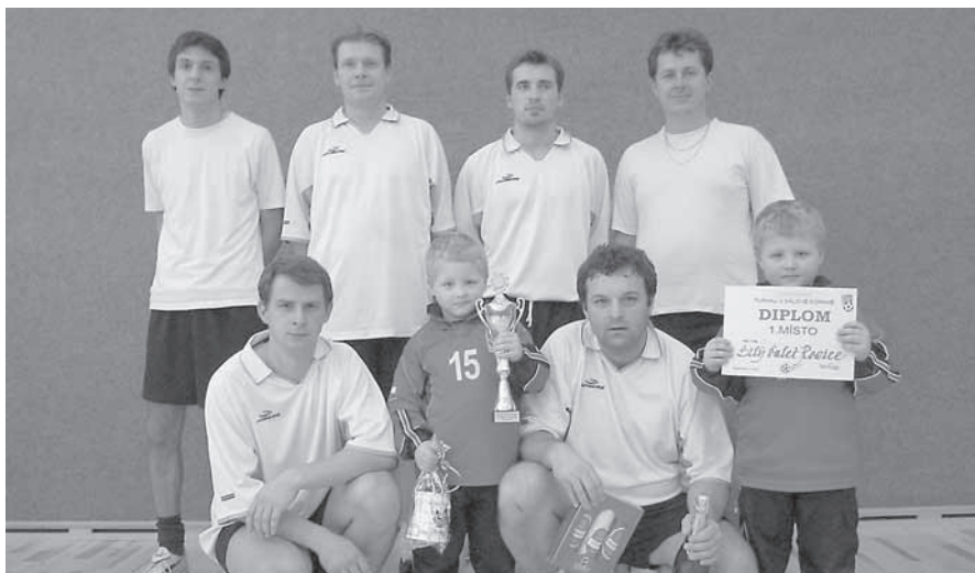
Vítězné družstvo BÍLÝ BALET ROSICE.

FC Spartaku A se však nevedlo ani v zápase o třetí místo, kde nečekaně podlehli družstvu Tropiku a museli se spokojit s výsledným čtvrtým místem.