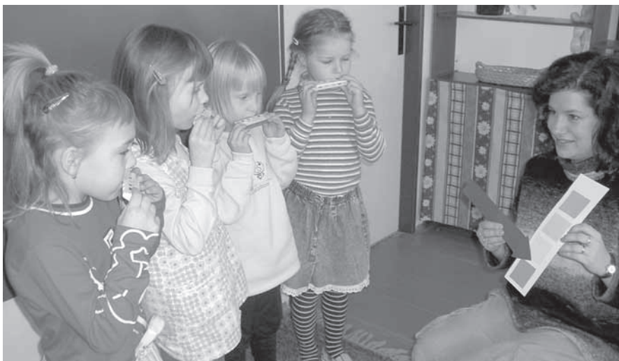
A takhle se to učíme.