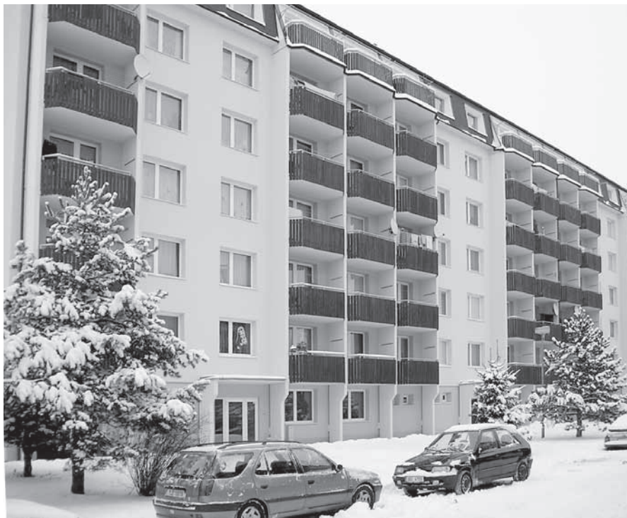
Dokončená závěrečná etapa revitalizace panelových domů.

V oblasti péče o naše seniory jsme zakoupili nový osobní automobil Fabia Combi na rozvážku obědů a další služby. Do domova důchodců jsme zakoupili nový elektrický vozík pro osoby s omezenou pohyblivostí za 150 tisíc korun.