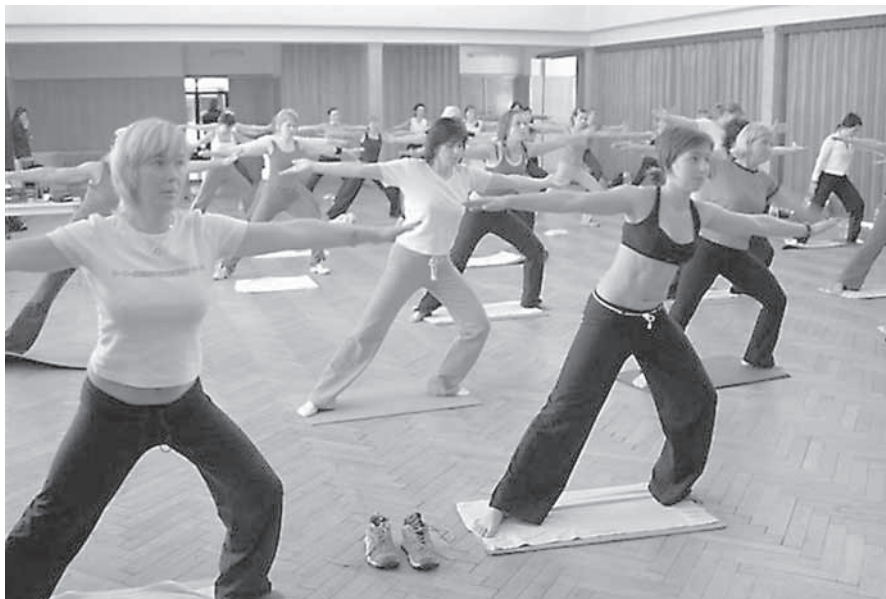
Závěrečná hodina jógy a strečinku.