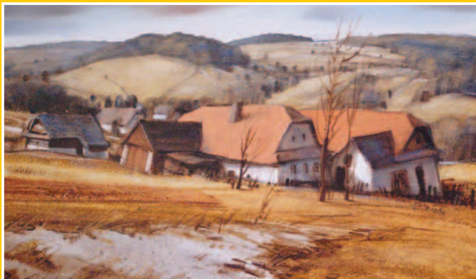
Malá ukázka z výstavy.

Dovolujeme si Vás co nejsrdečněji pozvat na vernisáž výstavy obrazů výše uvedených autorů, která se uskuteční dne 6. února 2006 v 17 hodin v nové Výstavní síni Klubu kultury, Masarykovo nám. 5, za účasti obou autorů