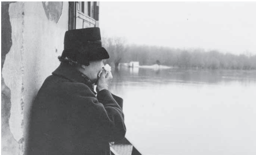
Máma se dívá přes Dyji na konci padesátých let.

Táta byl jiný případ. On byl chlap jako řemen. Nezlomila ho první světová válka, když byl jako důstojník na italské frontě. Nezlomila ho léta studia na brněnském Vysokém učení technickém, když se navíc snažil podporovat svoji mámu - vdovu