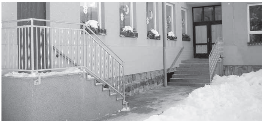
Téměř dokončený vstup do Mateřské školy U Stadionu.