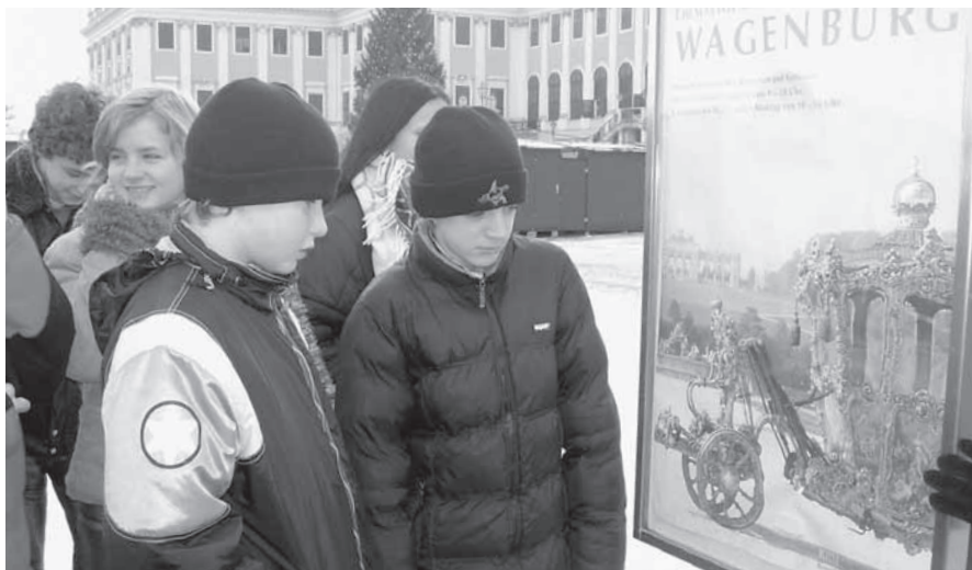
Prohlídka sídla Marie Terezie – Schönbrunn.