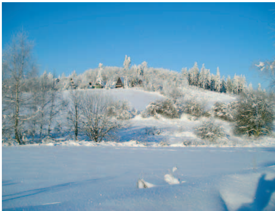
Heřmanovská „Strážnice“ (656,5 m n.m.) z ledna letošního roku TEXT A FOTO: ING. ALOIS KOUKOLA, CSc.

Pod tímto názvem budeme uvádět nový seriál článků popisujících přírodní zajímavosti kolem jednotlivých obcí i jejich historii. Chtěli bychom, aby tyto články byly oslavou naší krajiny.