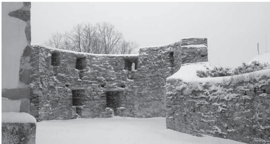
Hradby kolem kostela, severní bašta.