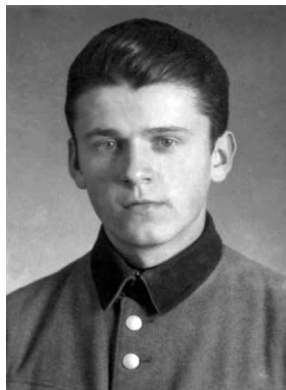
Autor v 17 letech

Chci připomenout menší úsměvnou příhodu. (Už jich mělo být velmi málo). Klášter měl větší dvůr a za ním do svahu navazovala zahrada, neboť byla na úpatí Špilberku. Jednou v létě jsme dostali chuť na třešně. Nevím, kolik nás již bylo. Snad tři, čtyři. Domluvili jsme se, že se na ně pozdě večer, až všichni budou spát, vypravíme. Museli jsme být velmi opatrní, neboť vždy některá sestra měla noční službu. Vše jsme již za dne promysleli. Největším problémem bylo prolézt mřížemi v okně do dvora. Jejich roztažením se nám to povedlo.