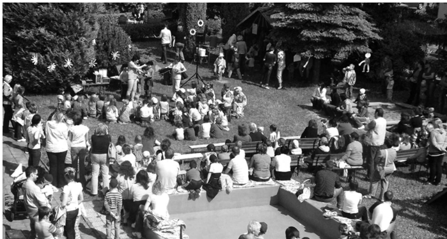
Z letošní zahradní slavnosti.