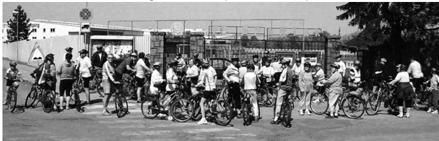
Na Jinošovské studánky letos v dubnu se nás sešlo 51.

Poslední sobotu v srpnu, 29.8.2009, bude celodenní výlet na Vysočinu, k hradu Lísek. Sraz opět v 9 hodin u fotbalového stadionu. Vyjedeme se toulat na sever po naší krásné Vysočině – lesy, rybníky, potoky, kopečky, krásné výhledy. Bude to trochu fuška. Vyjedeme naší známou trasou na Břeží, Vidonín, Vratislávka, Krčma, Mitrov, hrad Mitrov, zámek Mitrov, Bukov. Zde vjedeme do lesů a budeme hledat krásnou zříceninu hradu Lísek. To bude náš cíl. Zpět pojedeme na Stráž, Olší a Drahonín a odtud sjedeme k Louče do Trenkovy rokle. Tu nemůžeme vynechat. Přebrodíme Loučku a přes Víckov dojedeme do Žďárce, kde navštívíme naši oblíbenou hospůdku. Přes Rojetín a Níhov dojedeme domů.