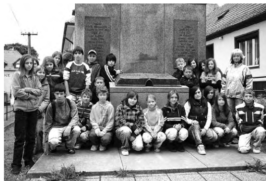
U pomníku Bible kralické.

Žáci 7. ročníku absolvovali na začátku června v letošním školním roce již poslední exkurzi, která pro ně byla připravena v souladu s naším školním vzdělávacím programem.