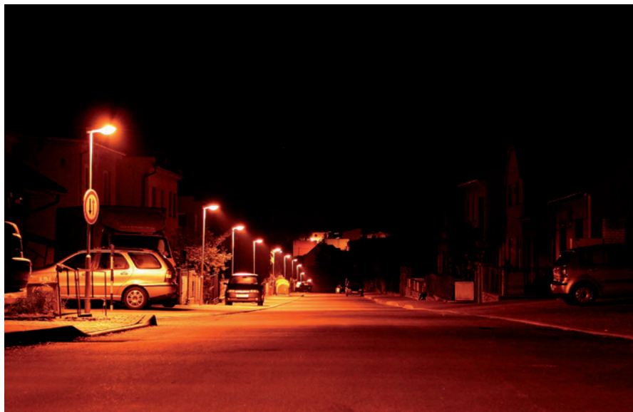
Týršova ulice v noci.