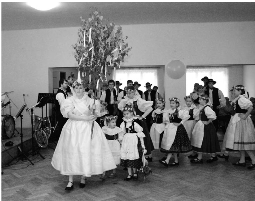
Královničky nastupují v jindřichovském kulturním domě.