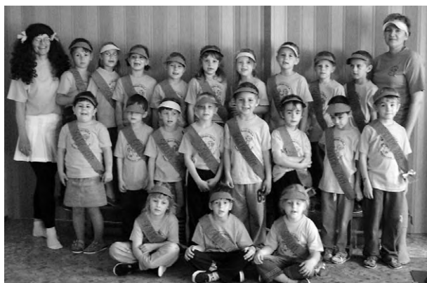
Loučení s předškoláky, pasování na školáky 2009.