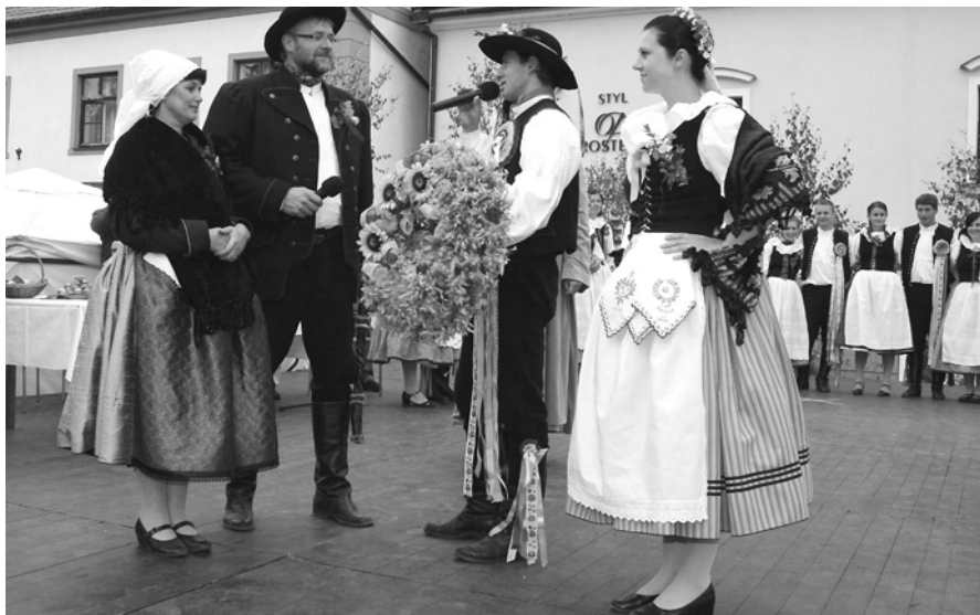
Loňský rychtářský pár a hl. stárek s hl. stárkovou.