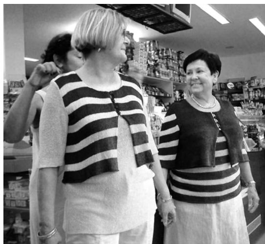
Momentka z módní přehlídky.