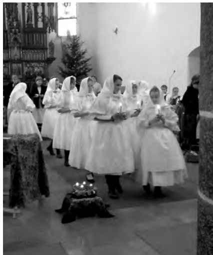
Dívky při adventním vystoupení.