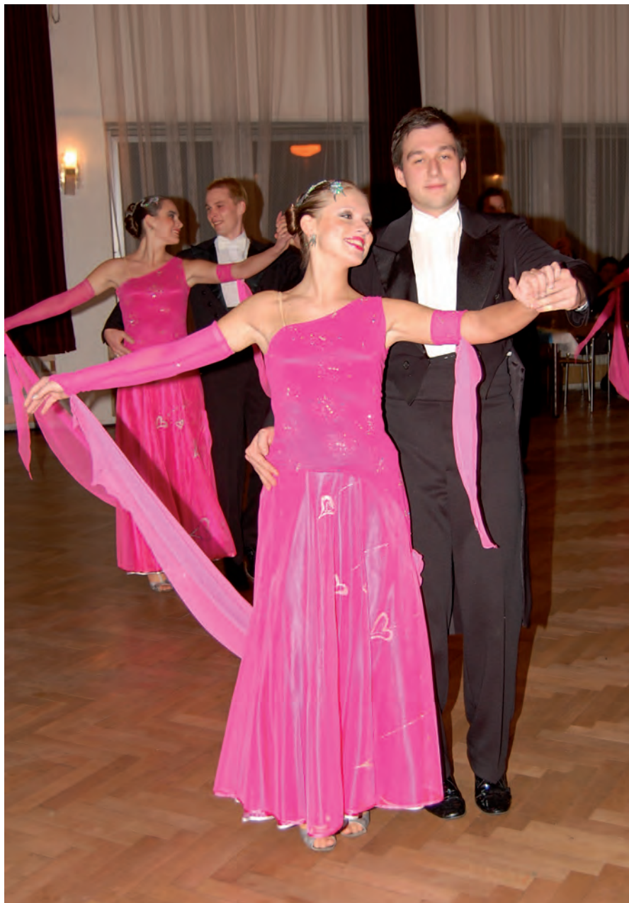
Plesová sezóna vrcholí.