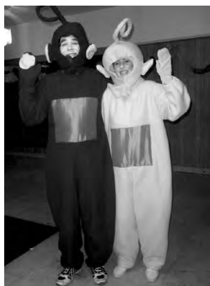
Maškarní bál 2009.