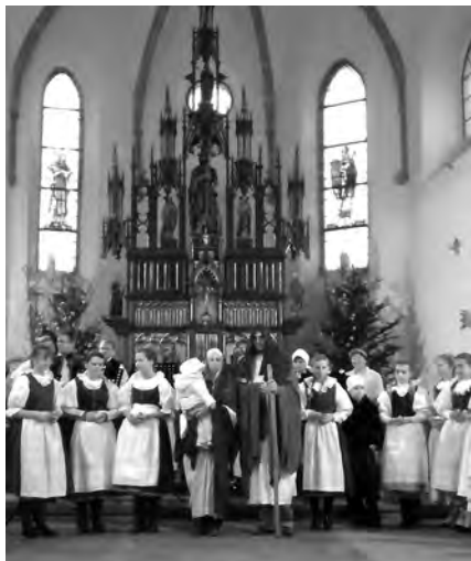
Svatá rodina s účinkujícími před oltářem.