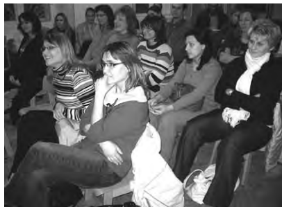
Účastníci besedy.

Letos poprvé na naší mateřské škole proběhla tzv. depistáž – orientační pedagogicko-psychologické vyšetření dětí před nástupem do základní školy. (Projekt ve spolupráci s Pedagogicko-psychologickou poradnou ve Žďáře nad Sázavou). Vyšetření prováděly dvě psychologičky, které na základě orientačních testů byly schopny říci, zda je dítě již schopno nástupu do školy, či se přiklonit k odkladu školní docházky.