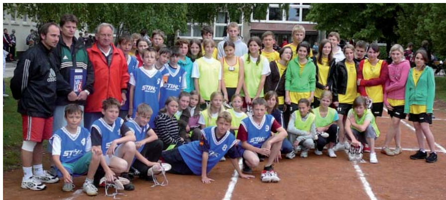
15. května 2009, celkem 45 žáků z bítešské ZŠ se zúčastnilo atletických závodů v rámci „Senecké olympiády“.

V průběhu školního roku jsou zařazovány a realizovány další aktivity podporující vzdělávací a výchovnou činnost školy. Podrobněji a aktualizovaně na www.zsbites.cz