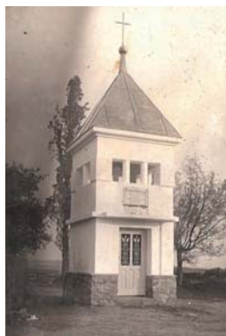
Zvonička (kaplička) zasvěcená Panně Marii Lurdské.