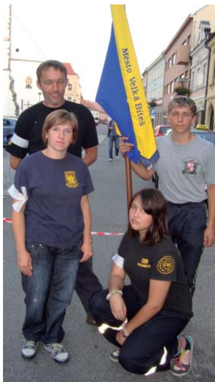
Družstvo Velké Bíteše.