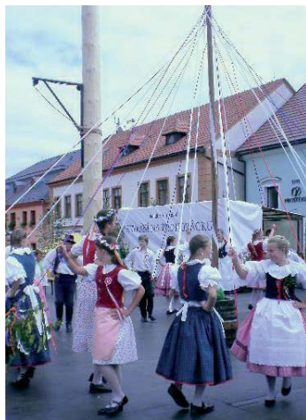
Májku společně zaplétají Bíteš a Ostrovačice.