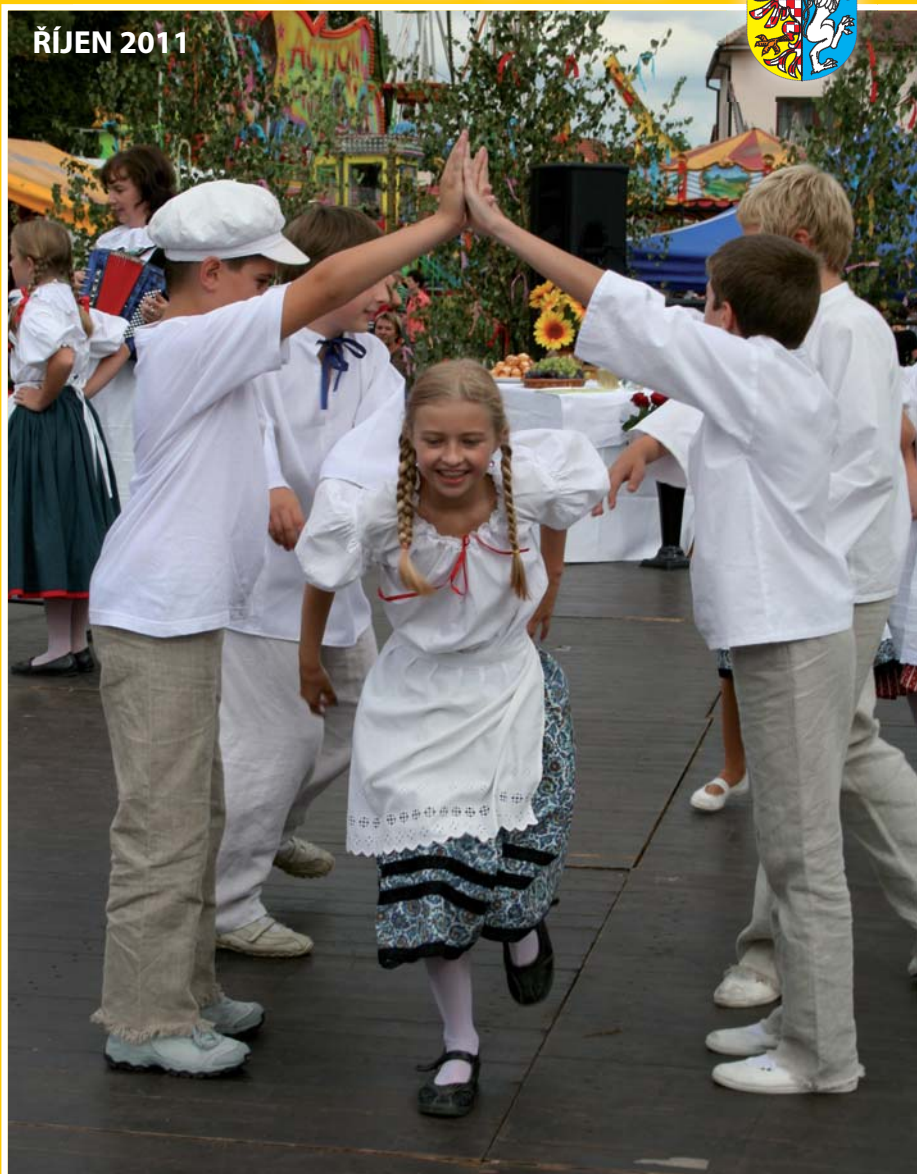
Soubor „Poškoláci“ při ZŠ.