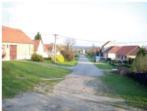
Pohled od západu směrem ke kapličce.