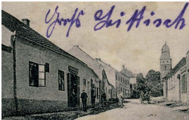
Dům čp. 68 nad pivovarem s pekařstvím a hospodou na sklonku 19. století (vlevo).