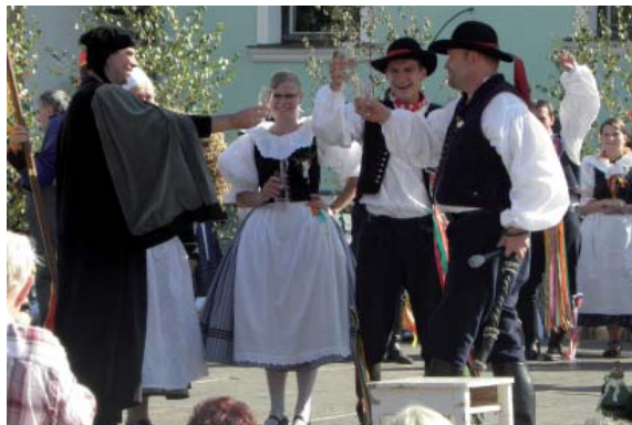
Či so hode?

Hody 2011, hody, na které budeme všichni rádi vzpomínat. Letošní rok pro nás byly hody úžasnou zkušeností. Děkujeme chase, že si vybrali nás jako hlavní pár, aby je vedl. Rádi bychom poděkovali rychtářskému páru, konšelům, písaři, celé chase, katovi, hodovým policajtům i cigánům za skvělou partu, díky které byly letošní hody perfektní. Moc bychom chtěli