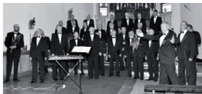
Pěvecké sdružení mor. učitelů.