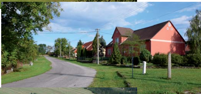
Horní část vesnice.