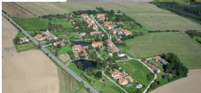
Letecký snímek obce Bezděkova.