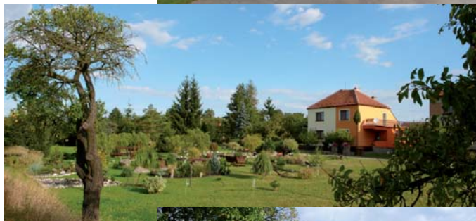
Pohled od státní silnice.