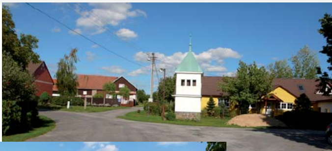
Střed vesnice s kapličkou.