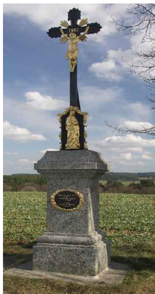
Kříž rodiny Šilhánových z roku 1880 po opravě rodinou Burešových v roce 2008.

polní cesta vroubená kameny posbíranými po okolí