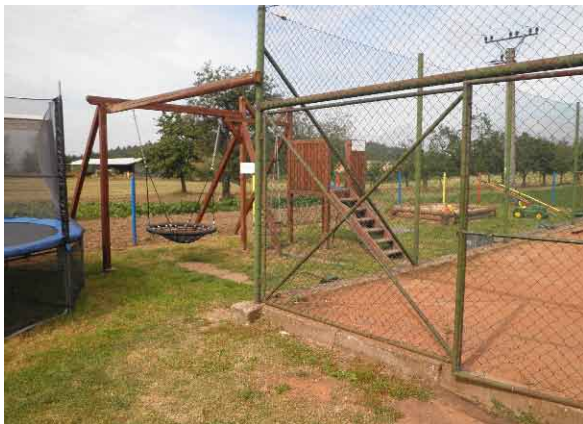
Sportovní a dětské hřiště.

Osadní výbor (OV) inicioval obnovu ovocných stromů na jinak nevyužitých obecních pozemcích. V intravilánu obce byla pro zlepšení dopravní obslužnosti opravena „ otočka “ autobusů a vybudována nová čekárna . Opravena byla i část pozemní komunikace před „kovárnou“ směrem k bývalému JZD. Vzhledem k tomu, že se tato komunikace nachází blízko dětského hřiště, požádal OV radu města o možnost instalace zpomalovacího retardéru.