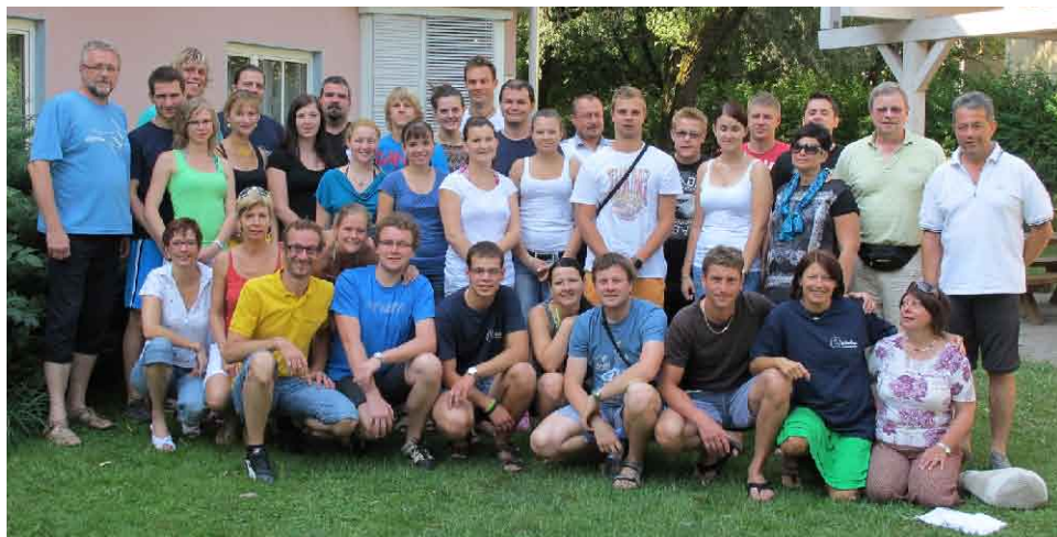
Bítešan v Rakousku.

Druhý den nás hned po snídani čekal program, kdy jsme nejprve poznávali historické památky města a poté přírodní krásy, zejména pak jezero WörtherSee s majestátně se tyčícími Alpami v pozadí. Původně jsme se v něm chtěli koupat, ale vzhledem k blížící se bouři jsme se jen pokochali obrovskými vlnami a vrátili se zpět na ubytovnu, abychom si před naším večerním vystoupením naposledy zopakovali naše taneční pásma. Někteří z nás ještě využili příležitost a navštívili výstavu Minimundus v Europaparku, což je největší park Klagenfurtu a také celého Rakouska, a ostatní se už začali připravovat na večer. Večer jsme se přesunuli na prostranství