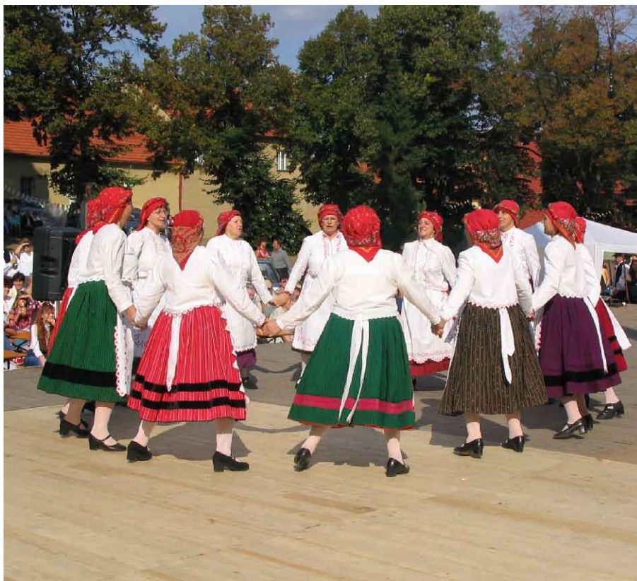
Na snímku skupina žen z Březníka

folklorní festival ve Velké Bíteši - sobota 8. září 2012