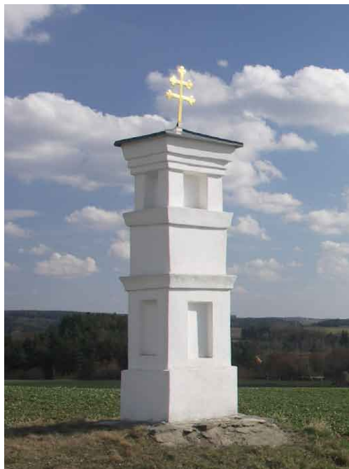
Boží muka nad vesnicí.