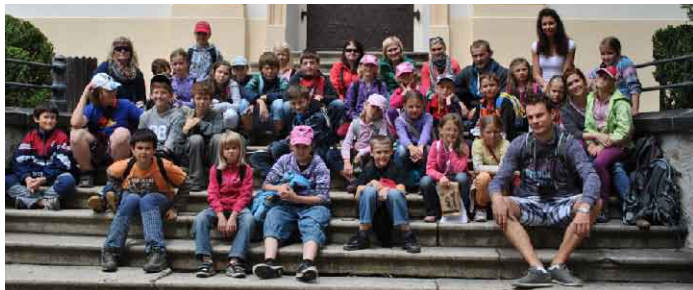
Společné foto na výletě v Třebíči.