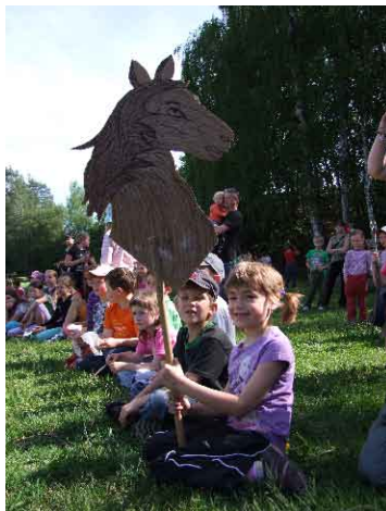
Děti s rekvizitou šermířské skupiny.

Další ukázky svého umění předvedly tradičně mažoretky z Lažánek, jejichž vystoupení bylo též velice pěkné a zajímavé.