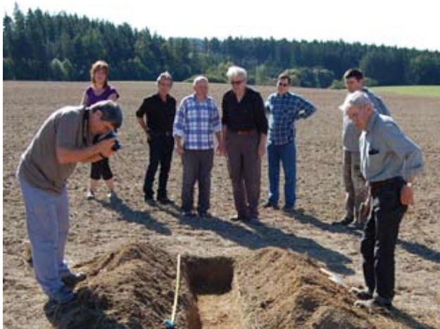
Průzkum na hranici katastrů Jestřabí-Nové Sady 25. 9. 2012.