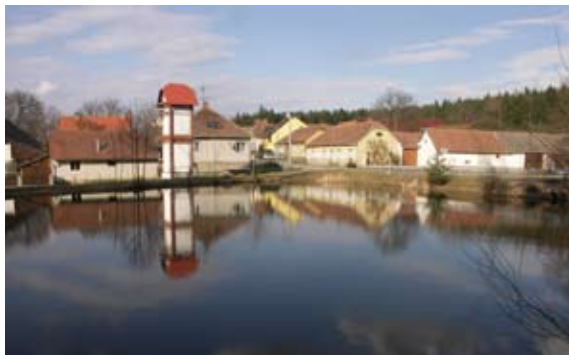
Pohled na vesnici od „dolního rybníka“

Pozn. autora: Pokládám za důležité a objektivní uvést na tomto místě výstižná slova kronikáře, tak jak on tyto historické události prožíval a své pocity v reálném čase zaznamenal: