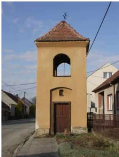
Zvonice na návsi.