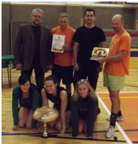
Vítězné družstvo turnaje Smajlíci.

První dva týmy z jednotlivých skupin se v pozdním odpoledni utkali o třetí a první místo. V boji o třetí místo byli úspěšnější Orli KP, čtvrtí skončili Křeni, obě družstva z Brna. V napínavém a vyrovnaném finále, kde byl k vidění krásný volejbal zkušených družstev, které se již dobře znají, zvítězili opět Smajlíci z Bystřice, Tuhý&Košinek obsadili druhé místo. Pořadí na dalších místech bylo následující: 5. místo Pyjonýři, dále pak naše družstva v pořadí Frantíkovci, Tullamore a Prosatín. Čestné poslední místo získalo družstvo Včera nic ze Slavkova.