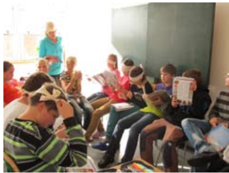
V hodině angličtiny.

Jak bychom se měli/neměli chovat k nevidomým? Myslím si, že bychom jim měli pomáhat, aby zvládali normální život. - Pomáhat jim a brát je jako jiného zdravého žáka. - Měli by-