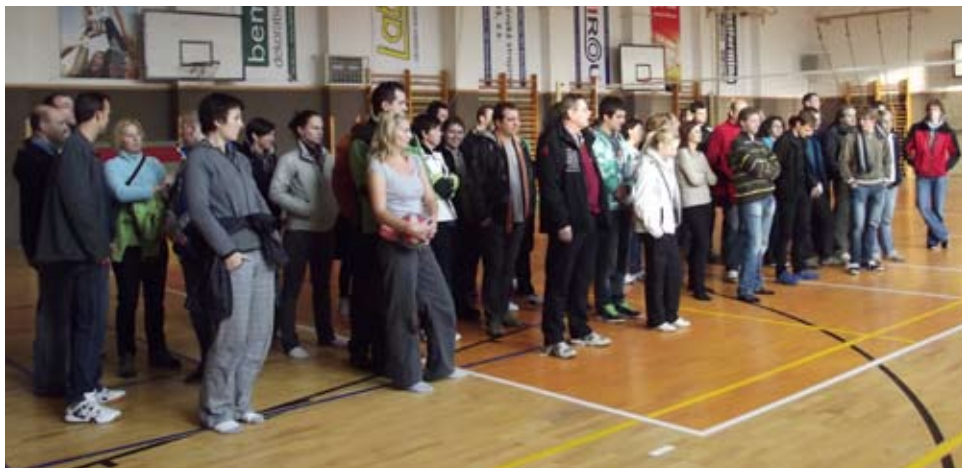
Nástup soutěžních družstev.