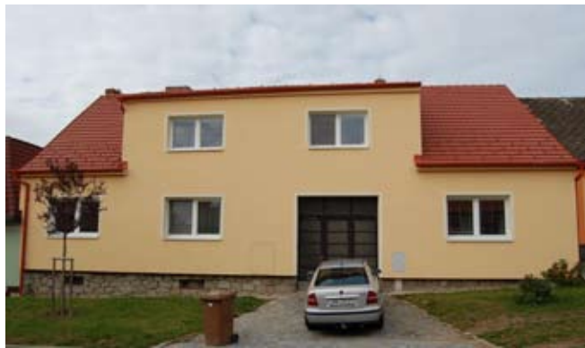
Dům čp. 92 v současnosti.