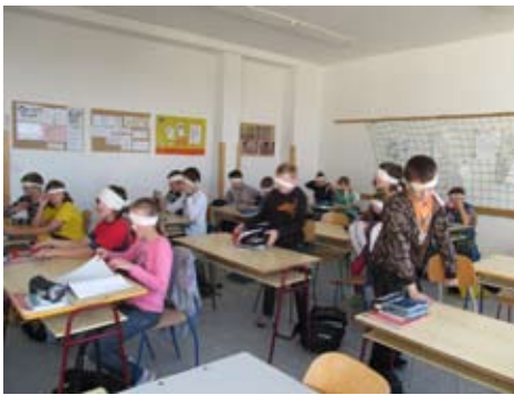
Výuka matematiky s handicapem.