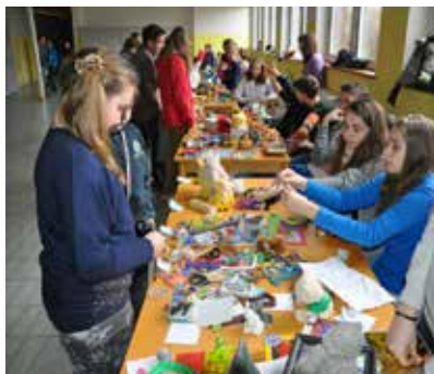
Předvánoční bazar.

Desátého a jedenáctého prosince proběhl již šestý předvánoční bazar. Žáci i učitelé si mohli zakoupit drobnosti, jako jsou plyšové hračky, bižuterie či ke-