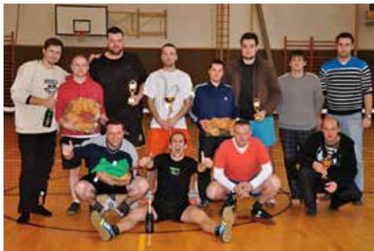
Ocenění hráči.

V pondělí 29. 12. 2014 se uskutečnil ve sportovní hale TJ Spartak 10. ročník turnaje v nohejbalu trojic. Turnaje se zúčastnilo 10 týmů. Po úvodním nástupu a seznámení s pravidly proběhlo rozlosování do dvou skupin po pěti týmech. Ve skupinách se hrálo systémem každý s každým, následovala vyřazovací část turnaje, to znamená čtvrtfinále, semifinále, zápas o 3. místo a finále turnaje. Vítezem se po celodenním soupeření