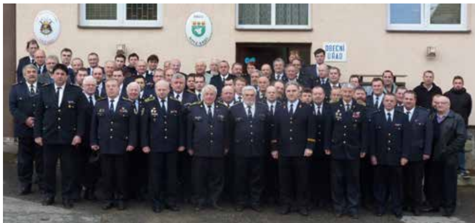
Společné foto.

blízním. Jedno se v té záplavě informací ale přehlédnout nedá – množství červených aut, objevujících se každodenně v podvečer na televizních obrazovkách. Jsou to auta hasičů. Pomáhají všude, kde se dá, a zdá se, že jsou jediní, kteří jsou schopni při všech těch nehodách, neštěstích a kalamitách účinně a organizovaně zasáhnout. Obdivujeme morálku a statečnost jejich posádek, ať profesionálních či dobrovolných. Také oni na počátku roku pravidelně bilancují.