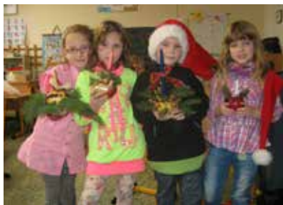
Vánoční besídka u prvňáčků.