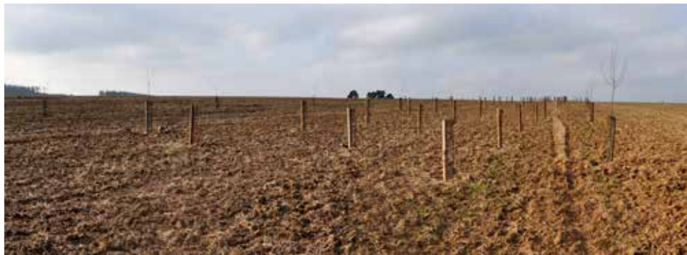
Biokoridor u novosadské borovice.

Krajina s rostoucím blahobytem člověka prodělala v minulých stoletích mnoho necitlivých změn a nevratných zásahů. Ať už to bylo vydrancování přírodních lesů a jejich postupná přeměna v nemocné monokultury, násilná kolektivizace po vzoru sovětských odborníků, rozorávající meze a narovnávací říční řečiště potoků až po dnešní bezohledné zabírání nejurodnějších polí ve jméno luxusních lidských obydlí, hal na skladování nadbytku a developerského byznysu, který dle statistik v naší zemi denně přemění cca 15 ha půdy na beton.