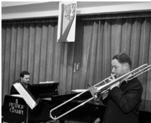
„Frajeři“ v KD.