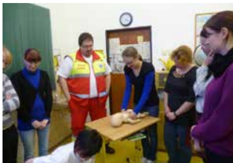
Školení první pomoci.

Záchranáři nám výstižně demonstrovali základní postupy v poskytování první pomoci a přiblížili problematiku záchranářství příběhy z praxe. Měli jsme možnost prakticky si vyzkoušet kardiopulmonální resuscitaci na figuríně dospělého jedince a také novorozence. Na závěr nám záchranáři umožnili prohlédnout si zařízení RZP vozu.