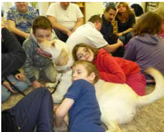
Canisterapie na ZŠ.

V pátek 16. 1. jsme měli na škole milou návštěvu čtyřnohých kamarádů s jejich páníčky. Přijeli k nám lidé z občanského sdružení Cantes, které sdružuje lidi zabývající se canisterapií. Z Brna za námi přibližně na dvě hodiny přijeli tři pejsci. Canisterapie se účastnilo asi 20 dětí ve dvou skupinkách. Některým dětem trvalo déle, než se odhodlaly pejska si pohladit, ale nakonec se zapojily všechny a psi všem na tváři vykouzlili úsměv. Bylo to moc příjemné setkání plné radosti a budeme se těšit na další.