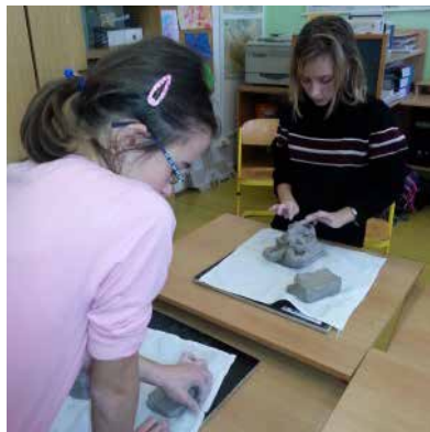
Práce s hlinou.