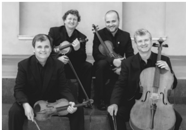
Wihanovo kvarteto.