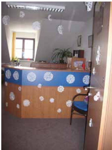
Recepce solné jeskyně.

Aby to všechno mohlo přirozeně přijít, tak Centrum pohody ve Velké Bíteši si pro vás připravilo únorovou pohodičku v solné jeskyni. Zaplatíte pouze 100 Kč na 45 minut a k tomu dostanete 30 minut v solné jeskyni ZDARMA , abyste se mohli skutečně odpojit od dnešního světa a soustředit se pouze na sebe a vaše nitro. Proto je tu zima a nabádá nás k těmto činům. Šetřit energii mluvením a organizováním. Pouze se učit naslouchat, pozorovat, plynout, vypnout. Pokud se toto všechno jako lidstvo naučíme, tak zdraví a úspěchy přijdou automaticky samy. Každý z nás bude vědět, kde je jeho skutečné místo. To, co všechno hledáte u ostatních, objevíte nejdříve u sebe – štěstí, lásku, zdraví, harmonii. Atd.