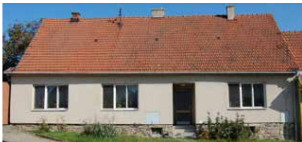
Dům čp. 125 „v koutku“ v současnosti.