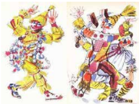
Koza, kůň a stračena,

Medvěďář a hadrnice už se ženou do světnice, k tanci hraje zvesela masopustní kapela.