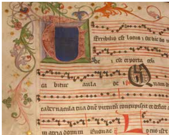
Detail stránky graduálu z klonku 15. století.

Zajisté lze předpokládat, že centrem hudebního života ve Velké Bíteši býval od svého počátku ve 13. století kostel. Zde býval rozvíjen zejména duchovní zpěv. Ze sklonku středověku jsou toho v městském muzeu hmotnými doklady olomoucký graduál zřejmě z 80. let 15. století, misál vytištěný v roce 1499 v Norimberku (vrchnostenský dar z roku 1506) a žaltář vytištěný též v roce 1499 v Brně. Vnitřní potřebu hudby vystihl v 15. století městský písař v mimovolné poznámce v městské knize: „ sám sobě hudu, sám sobě vesel budu “.