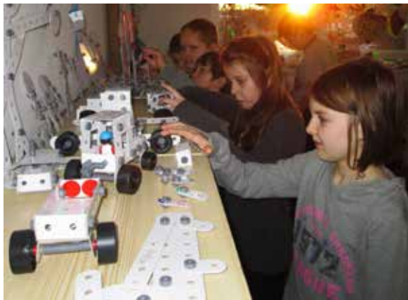
Stavebnice budou provázet žáky i v dalších ročnících.

Žáci druhého a třetího ročníku si procvičují zručnost při práci se stavebnicemi. Ty jsme zakoupili z příspěvku 49.620 Kč v rámci projektu Podpora polytechnické výchovy v mateřských a základních školách v Kraji Vysočina . Projekt je podpořený Krajem Vysočina, MŠMT a partnery: PRETOL HB s.r.o., IČO 25923501, Wikov Sázavan s.r.o., IČO 48950874, Chládek a Tintěra Havlíčkův Brod, a.s., IČO 60932171, FRAENKISCHE CZ s.r.o., IČO 26308223, První brněnská strojírna Velká Bíteš, a.s., IČO 00176109, a PSJ, a.s., IČO 25337220. Z vlastních prostředků jsme zakoupili dalších 58 stavebnic, aby s nimi mohli pracovat všichni žáci v těchto třídách.