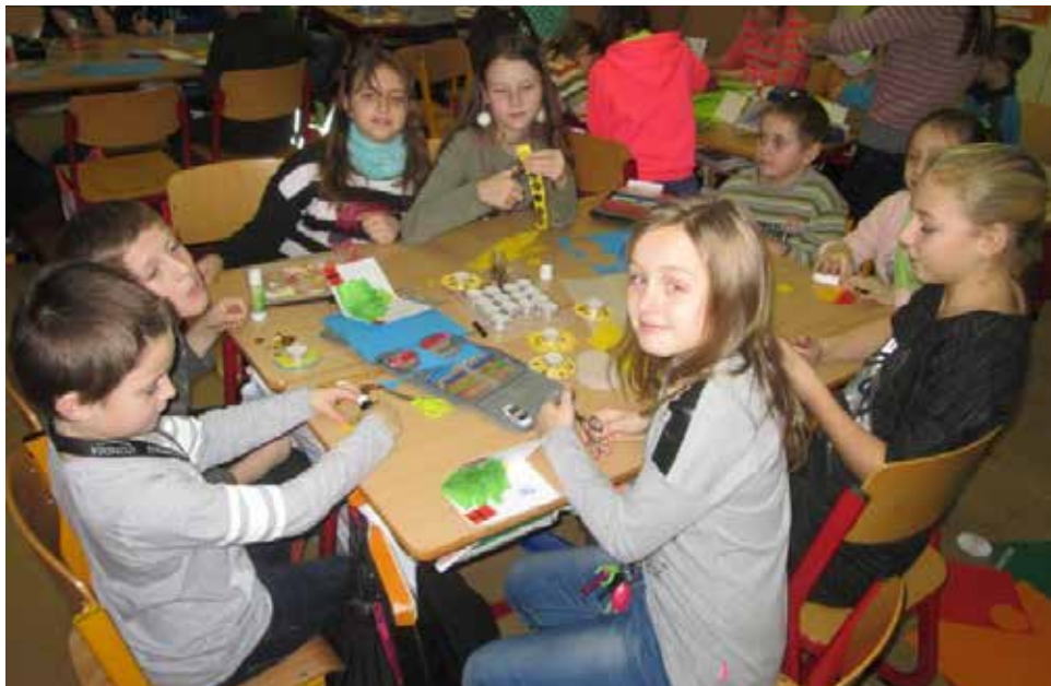
Vánoční dílničky.

V úterý 15. prosince 2015 proběhl celodenní projekt žáků devátých tříd s názvem Média. Nejzajímavější částí projektu byla určitě tvorba vlastního třídního časopisu. Žáci se proměnili v redaktory a šéfredaktory, korektory a grafiky. V týmech zpracovávali informace o své třídě, dění ve škole, městě a jeho okolí. Nelehké bylo vymyslet zajímavý a trefný název. Žáci poznamenali, že je práce bavila, ale netušili, jak náročná práce novinářů může být.