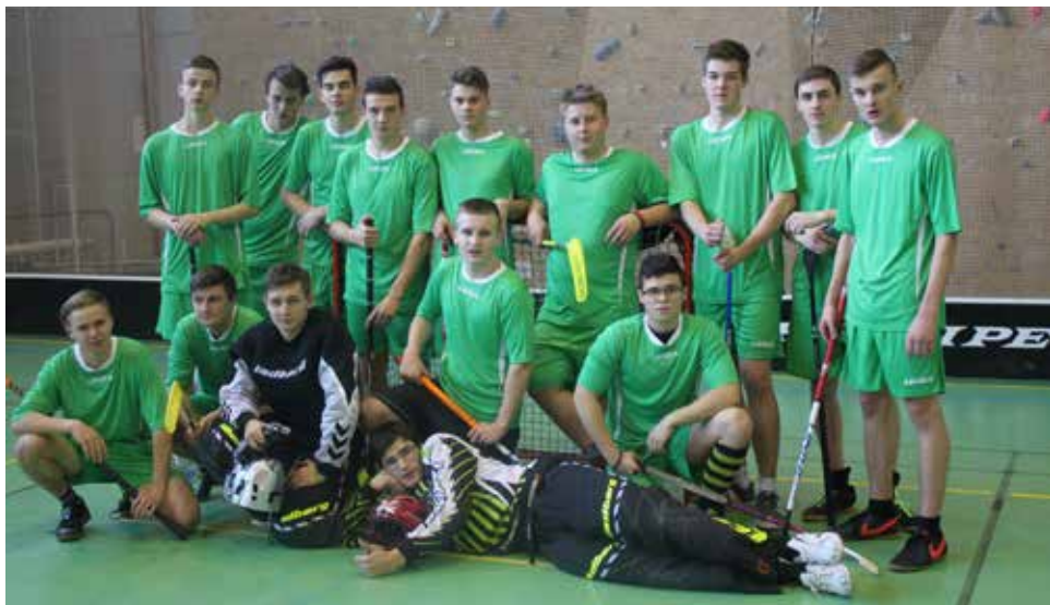
Společné foto hráčů ze SOŠ Jana Tiraye.

zápasu s gymnáziem (4 : 1) si zajistili postup do okresního kola. Okresní kolo proběhlo dne 14. 1. 2016 v Bystřici nad Pernštejnem. Kluci ze skupiny postoupili z druhého místa a proboujvali se až do finále. Zde prohráli se SPŠ Žďár nad Sázavou (3 : 2), což pro ně bylo velkým zklamáním, protože zápas byl velice vyrovnaný a šance byly na obou stranách stejné. Naše družstvo bojovalo až do poslední minuty, gól nám ale bohužel padnout nechtěl. Ze šesti zúčastněných družstev jsme se nakonec umístili na krásném druhém místě.