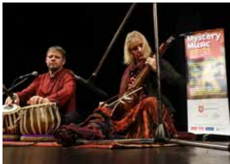
Z festivalu.

Festival Mystery Music si dal do vínku přinést na naši hudební scénu mysteriózní, záhadný či přesahující prvek. A to se mu také podařilo. V jednom dni proběhly tři koncerty „Od kořenů ke hvězdám“. Na prvním zaznělo didgeridoo, druhý přinesl klasickou indickou hudbu a třetí byl složen ze skladeb podle horoskopu sestaveného přímo pro den konání festivalu, tedy 20. prosince v Buranteatru v Brně.