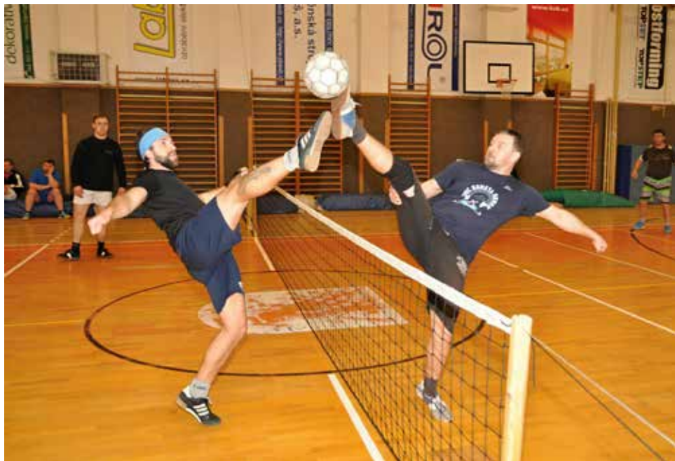
Z turnaje.

s pravidly proběhlo rozlosování do dvou skupin po pěti týmech. Ve skupinách se hrálo systémem každý s každým, následovala vyřazovací část turnaje, to znamená čtvrtfinále, semifinále, zápas o 3. místo a finále turnaje. Vítězem se po celodenním soupeření stal tým HOP. Druhé místo obsadil tým 2+. Na třetím místě skončil tým DELEGÁTI a na čtvrtém JELÍNCI. Vítězné týmy byly odměněny věcnými cenami. Poděkování patří všem zúčastněným a také sponzorům turnaje – PBS a.s., LABARA s. r. o., SPORTBAR Klíma, potraviny MANFOOD Janda, Jeřábkova pekárna, MIHAL s. r. o., restaurace „Na 103“ a restaurace „U Vrány“.