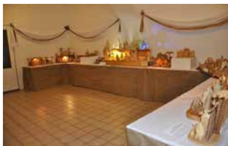
Pohled do výstavy.