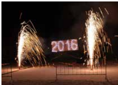
Začátek ohňostroje.

Pro všechny přítomné byl na zahřátí zdarma připraven námořnický svařák a teplý ovocný čaj. Závěrem jsme zhlédli již tradiční nádherný několikaminutový novoroční ohňostrojek v produkci bítešského ohňostrojuce Miloše Janečka. Fotodokumentace i video ohňostroje můžete ještě jednou zhlédnout na www.bitessko.com .