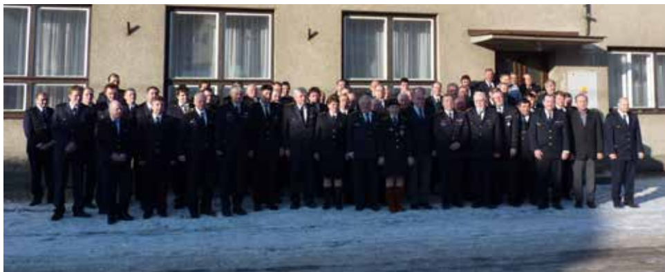
Společné foto. | Foto: Silvie Kotačková

moravského kraje, starosty obcí a delegáty zúčastněných sborů. Následovala připomínka významných zesnulých zasloužilých členů vedení okrsku, okresního sdružení hasičů, HZS Kraje Vysočina, územní odbor Žďár nad Sázavou. Minutou ticha byla uctěna jejich památka.