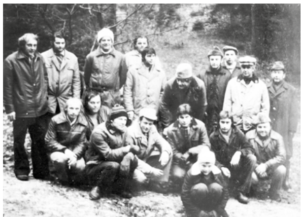
Společné foto z místa setkání v roce 1976.

Jdeme dále do údolí, procházíme lesními cestami, po roz-