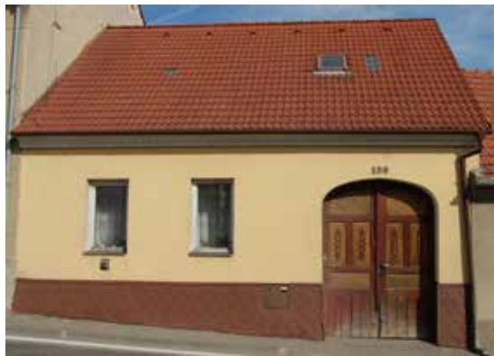
Dům čp. 139 v současnosti.

Seriál o domech a jejich majitelích na náměstí, v ulicích i na předměstích Velké Bíteše zabývající se dobou před rokem 1871. Nyní RŮŽOVÁ ULICE, DŮM ČP. 139: