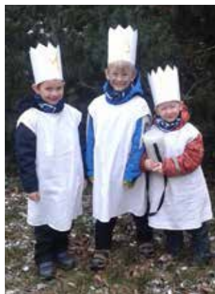
Tři Králové.

Tříkrálová sbírka je největší sbírkou, jaká se v Česku pořádá. Letos koledovalo přes šedesát tisíc koledníků. Nezanedbatelné je, že nás sbírka učí pomáhat druhým.