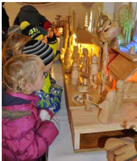
Návštěva dětí z MŠ U Stadionu.