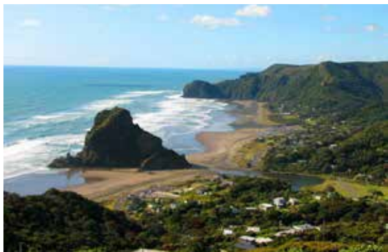
Vyhlášená surfařská pláž Piha nedaleko Auclandu.

do fjordů, k vodopádům, ledovcům či Palačinkovým skalám. Současně se dozvíte, že podobnou cestu je možné absolvovat i na invalidním vozíku.