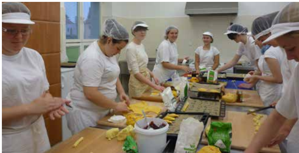
Cukrářky ze SOŠ při práci v odborném výcviku.

Ve dnech 22. – 26. února 2016 bude ve výstavní síni Klubu kultury otevřena výstava SOŠ Jana Tiraye. Zájemci mají příležitost prohlédnout si vybrané práce našich žáků, v dopoledních hodinách dokonce některé z nich „ochutnat“.