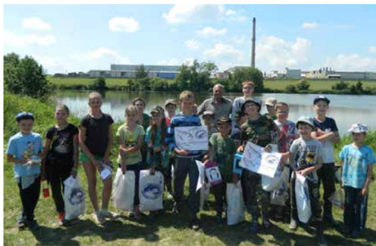
Účastníci soutěže „Zlatá udice“.

V sobotu 26. května 2018 se ve Velké Bíteši u rybníka Královského opět po roce sešli mladí rybáři rybářského kroužku MRS, z.s., Pobočného spolku Velká Bíteš, aby změřili své dovednosti a znalosti v závěrečné disciplíně místního kola soutěže pro děti a mládež „Zlatá udice“. Čekal je „Lov ryb udicí“. Rybářský kroužek ve Velké Bíteši navštěvuje celkem 64 dětí, všechna kola soutěže absolvovalo 34 z nich.