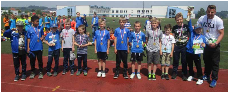
McDonalds Cup.

O zážitky z Mohelenské hadcové stepi a Kralic se s vámi podělí Lucka Loupová a Kája Špačková ze 7. C: „Dne 16. 5. 2018 jsme se zúčastnili exkurze do Mohelna a Kralic. Nej-dřív jsme navštívili Památník Bible kralické, kde jsme viděli kostel, muzeum a tvrz. Paní průvodkyně nám ukázala, jak se tiskly knihy v dřívější době. Poté jsme jeli na Mohelenskou hadcovou step. Celý výlet se nám moc líbil a hodně jsme se toho dozvěděli.“