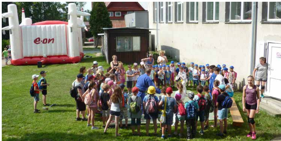
Z Dětského dne.

Jako každoročně se děti mohly seznámit s prací zdravotnických záchranářů Zdravotnické záchranné služby Kraje Vysočina z posádky rychlé zdravotnické pomoci Velká Bíteš. Své obdivovatele mělo i Dálniční oddělení policie Domašov s ukázkou policejního vozidla