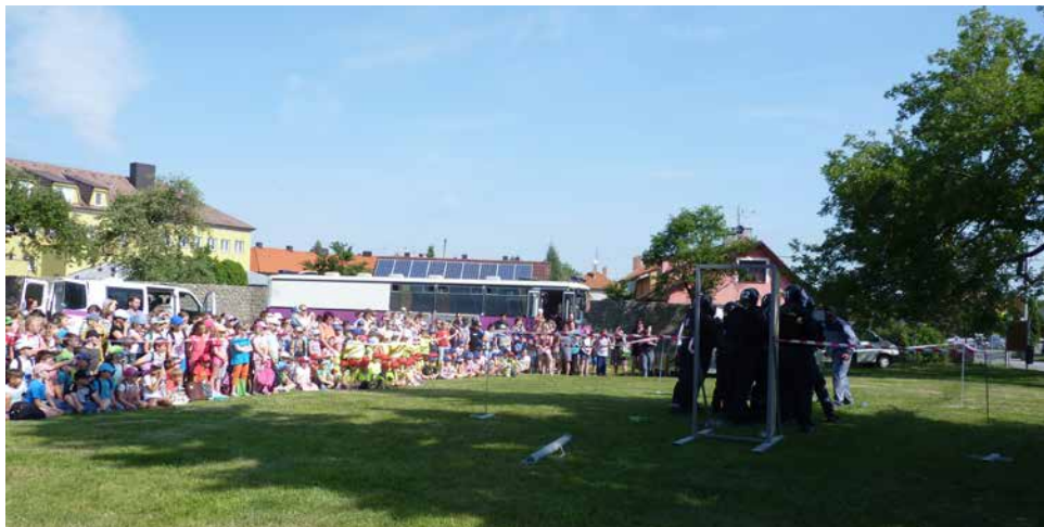
Z Dětského dne.

VW Transporter a velmi rychlého moderní technikou vybaveného automobilu Škoda Octavia. Místní spolek Českého červeného kříže z Velkého Meziříčí připravil výuku základní laické resuscitace a zodpovídal na všetečné otázky ohledně první pomoci.