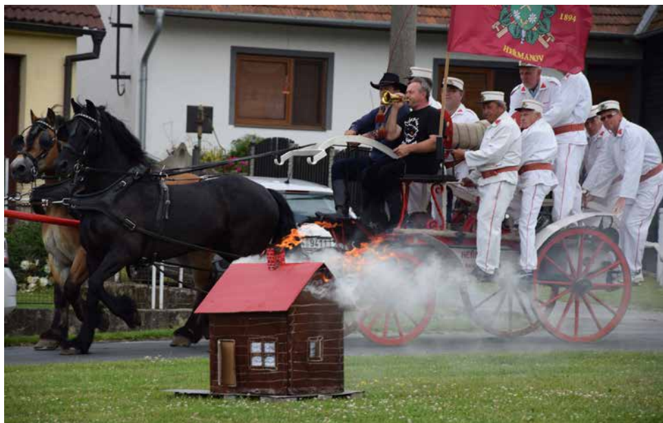
Heřmanovští hasiči se projeli před soutěžní komisí s historickou stříkačkou.

Celkem 23 vesnic z 9 různých států se utkalo o prestižní Evropskou cenu obnovy vesnice 2018 , jejímž motem je „myslet dopředu“. Porota s mezinárodním a mezioborovým složením začala v polovině dubna 2018 v rámci setkání v Mnichově, s vícestupňovým procesem hodnocení, který pokračoval v měsících květnu a červnu 2018 návštěvami přímo na místě