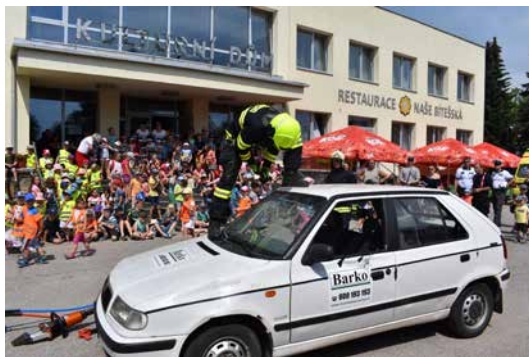
Z Dětského dne.

Tradičně se představila zásahová technika Hasičského záchranného sboru Kraje Vysočina -požární stanice Velká Bíteš a Sboru dobrovolných hasičů Velká Bíteš, Dopravní policie ČR, Armády ČR z 22. základny vrtulníkového letectva Náměšť nad Oslavou, Věžeňské služby ČR z věznice Rapotice, silniční odtahové služby ASSIST 24, Bítešské dopravní společnosti s.r.o. Velká Bíteš.