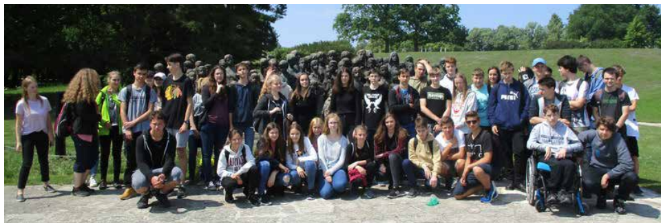
V Lidicích.

V pátek 18. května žáci devátých zamířili do Malé pevnosti v Terezíně, kde si prohlédli cely, samoty a také zhlédli dokumentární film. Následovala návštěva památníku Lidice. Zdejší syrová expozice připomínající smrt nevinných dětí, žen a mužů všechny dojala.