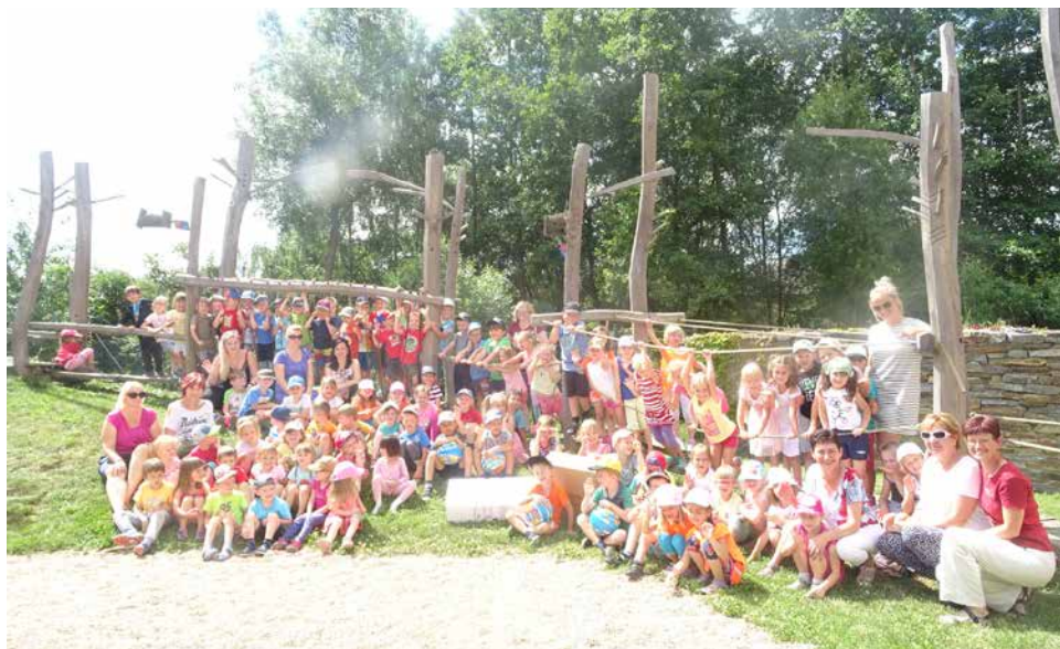
Společné foto při předání cen.

Za účast v soutěži obdržely děti ze všech tříd balíčky a výherní tříďe Soviček byla dne 19. 6. 2018 slavnostně předána cena od zástupců firmy PEZ v podobě tělovýchovných pomůcek na rozvoj koordinace a tělesné zdatnosti dětí (míče, eliptical a rotoped).