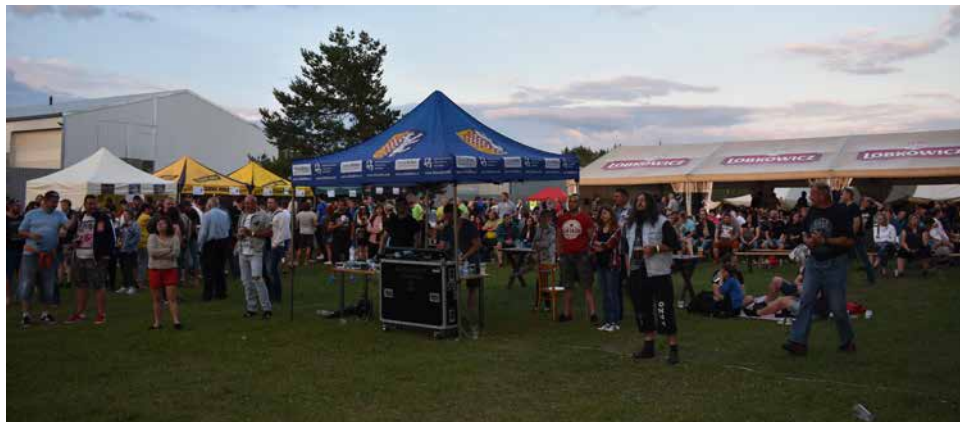
I. ročník Beerfestu.