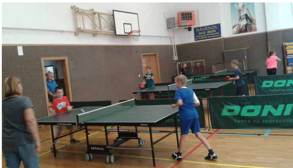
Z turnaje.

V neděli 3. 6. 2018 se konal 6. ročník turnaje dětí ve sportovní hale TJ Spartak Velká Bíteš. Mladí hráči TJ Spartak Velká Bíteš předváděli nad očekávání dobré výkony ke spokojenosti jejich trenérů. Umístění: