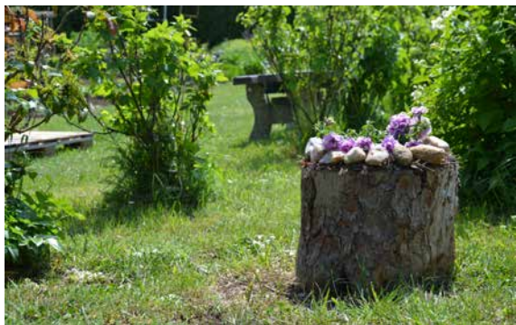
„Přírodní zahrada“. | Foto: Lenka Oberreiterová

snažíme co nejvíce využívat ve výuce, k relaxaci, práci i hře. Do zahrady jste se mohli přijít podívat v pátek 8. června 2018. Dopoledne jsme měli připravený program pro mateřské školy, navštívily nás i maminky s dětmi a odpoledne byla zahrada zpřístupněna široké veřejnosti. Letošní aktivity byly zaměřeny na přírodu a zvířata žijící v ní. Soutěžící si tak vyzkoušeli ochutnávání šťáv jako motýlci, vyráběli pavoučí síť jako křižák, vybírali krmení pro kapra nebo se zkoušeli plazit jako zmije.