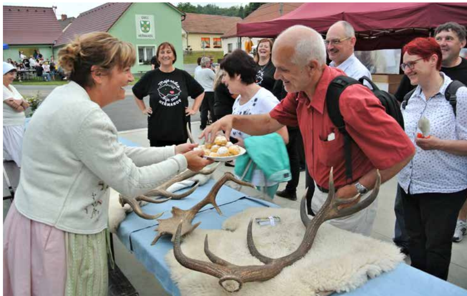
Paní farmářka nabízí Evropské komisi domácí koláčky.

Byl jsem pověřen vyzvednutím členů komise na náměstí ve Velké Bíteši a jejich „dovedením“ do Heřmanova, jehož dostupnost byla v té době omezena rekonstrukcí téměř všech spojovacích silnic. Členové komise, dva pánové z Rakouska a jedna dáma ze Slovinska, již seděli u stolečku před cukrárnou a při popíjení kávy obdivovali naše náměstí. Po jeho krátké prohlídce jsme se vydali do Heřmanova komplikovanou cestou přes Milešín, přes vyvýšeninu Chřib (619 m n. m.) s krásným výhledem na vesnici. Spatření překvapivě malebné krajiny za horizontem inspirovalo předsedy komise k pořízení několika fotografií. Byl to první pozitivní dojem, po kterém následovalo oficiální přijetí vedením