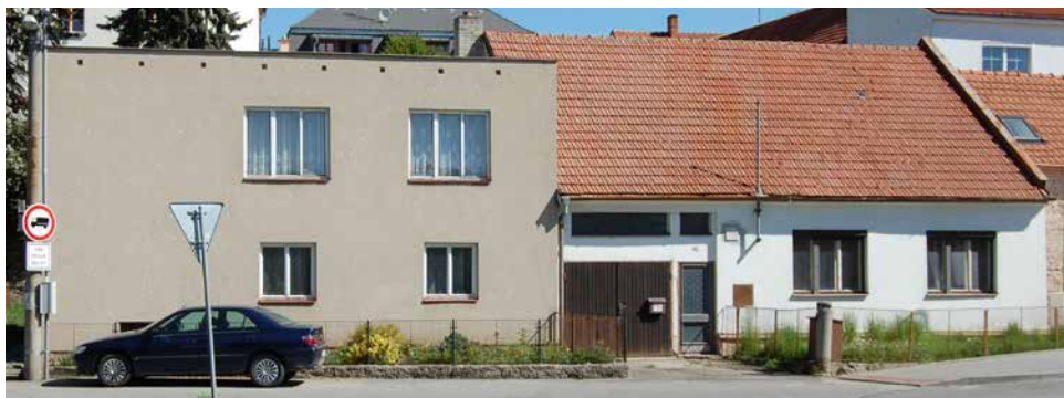
Dům čp. 166 i s čp. 559 v současnosti.

Seriál o domech a jejich majitelích na náměstí, v ulicích i na předměstích Velké Bíteše zabývající se dobou (již) před polovinou 20. století. Nyní ulice POD HRADBAMI , čp. 166: