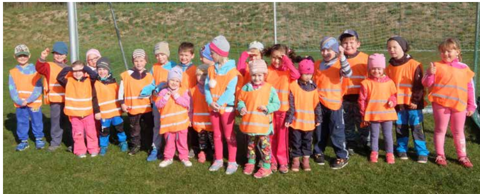
Třída Motýlci na Sportovním dni.

Ve čtvrtek 11. října 2018 se třídy Motýlci, Sluníčka, Sovičky a Včeličky vydaly na fotbalový stadion, kde na ně čekaly sportovní aktivity pod vedením trenéra Vítězslava Kratochvíle.