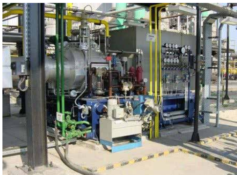
Expanzní turbína ETG pro Maďarsko.

a radiálního kompresoru jsou uložena na společném hřídeli. Kompresor bývá zařazen do výrobního procesu nebo může pracovat v samostatném okruhu. Regulace průtočného množství se provádí buď výměnou rozváděcích lopatek turbíny nebo jejich natáčením.