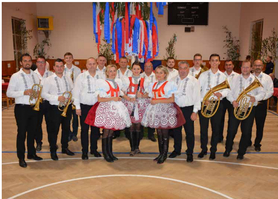
DH Miločanka.

V pátek 7. prosince v 19.00 hodin se v sále kulturního domu uskuteční Vánoční koncert dechové hudby „Miločanka“. Dechová hudba z Milotic u Kyjova v roce 2016 „znovuoobnovila“ své působení mezi slováckými dechovými hudbami působícími na kyjovském