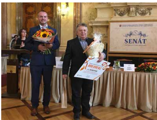
Slavnostní předání ceny.

Děkuji všem občanům, kteří se podíleli na přípravě a průběhu prezentace obce v soutěži. Vše dělali ve svém volném čase a mají velký podíl na získaném ocenění.