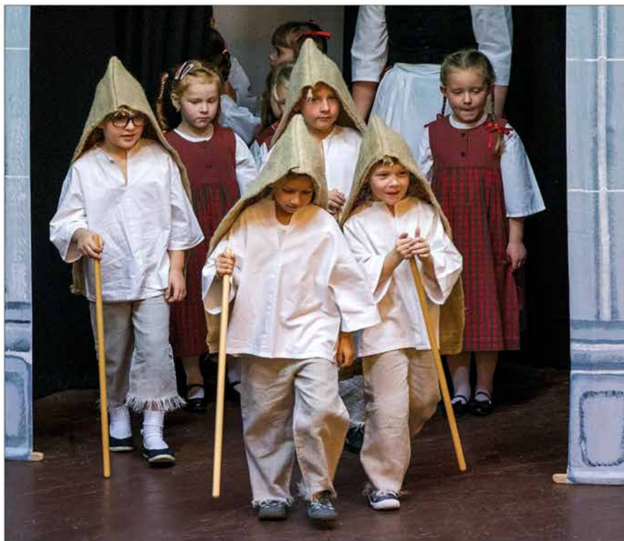
Na bitešském jarmarku 2017 - Bítešánek