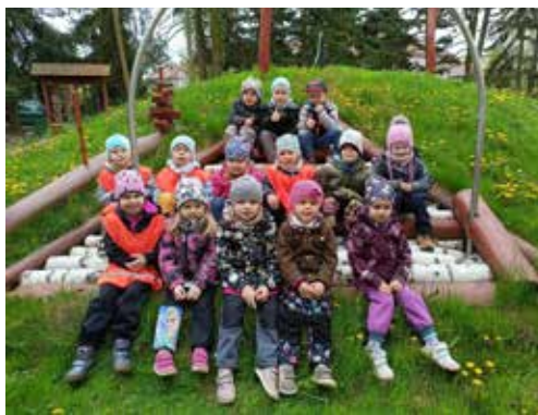
Děti ze Zelené třídy na školní zahradě. | Foto: Archiv MŠ

Ani v květnu nechybělo divadelní představení. Přijelo k nám Divadlo Rybyraky s pohádkou O začarovaném princovi, ježibabě a odvážném Amálce. Děti zhlédly příběh, jak statečná Amálka zachránila ježibabu a prince.