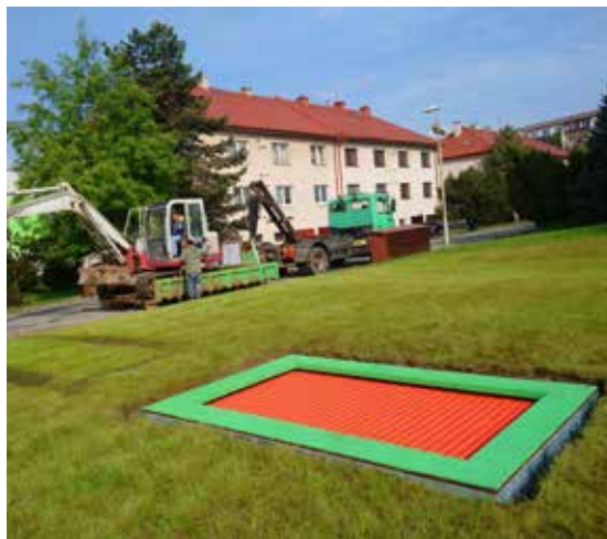
Kde se nachází vyobrazená trampolína?

Kde se nachází ve Velké Bíteši vyobrazená trampolína?