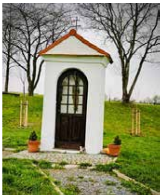
Břízy himalájské (Jacquemontovy) u kaple sv. Antonína.