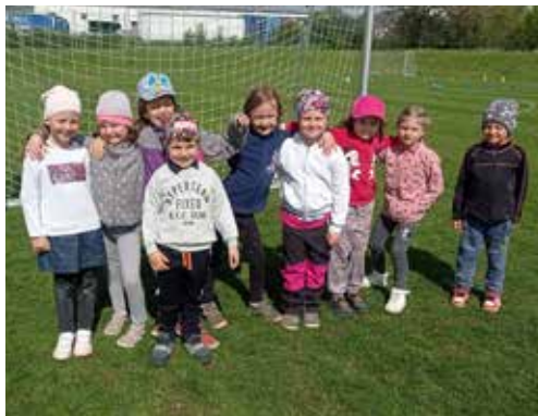
Sportování s Vítou.

Na začátku května se děti vydaly do Městské knihovny Velká Bíteš, kde si pro ně paní knihovnice připravily zajímavý program s pohádkou O Červené karkulce. Paní knihovnice dětem pohádku nejprve přečetla. Děti pilně naslouchaly, aby na konci mohly správně odpovídat na otázky k pohádce. Poté děti plnily různé úkoly: skládaly rozstříhané obrázky, vyráběly loutku nebo pomohly Červené karkulce najít cestu lesem. Na závěr si děti mohly půjčit a prohlédnout knížky. Některé děti půjdou již v září do školy, a tak se třeba budou rády do knihovny vracet, aby si knížky mohly i samy přečíst.