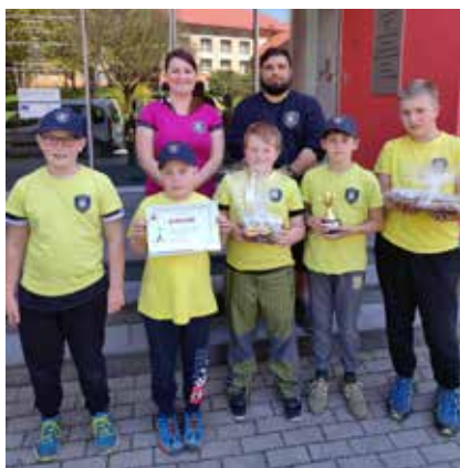
Ze soutěže.

Družstvo MH z Velké Bíteše 1. místo. Soutěž mladých zdravotníků má přispět k ověření znalostí a praktických dovedností v poskytování první pomoci dětmi. Vítězové okresních kol se setkají v krajském kole 23. 5. 2023 v Třebíči.