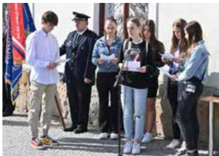
Kameny zmizelých.