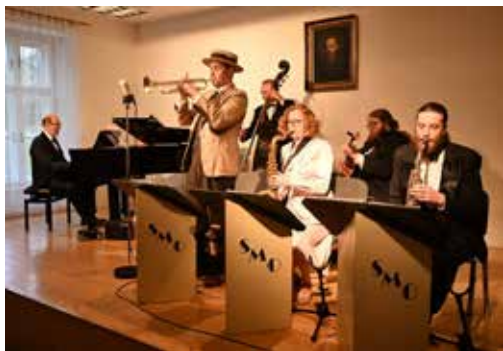
Z koncertu.