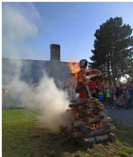
Zapálená čarodějnice. | Foto: Silvie Kotačková