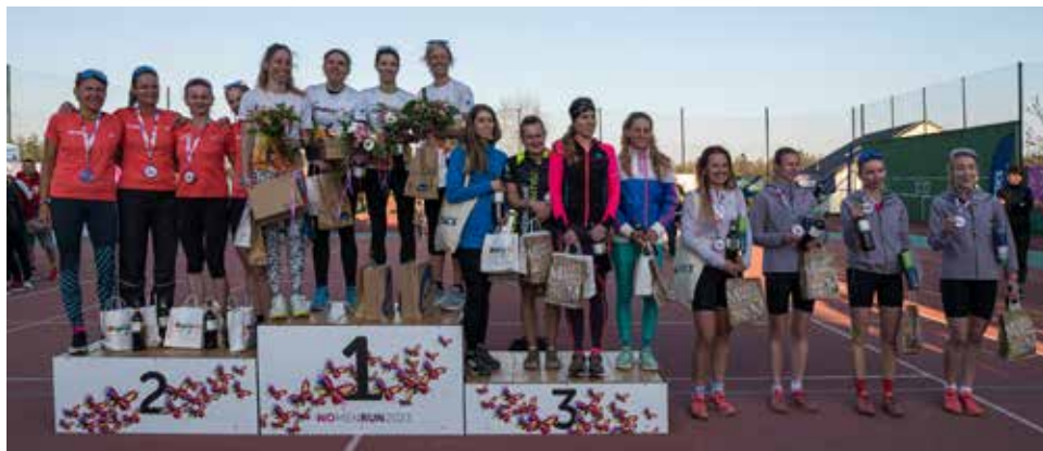
Stupně vítězek.

NoMen Run je běžecký závod pro maximálně čtyřčlenné týmy , které běží štafetovým způsobem z Nového Města na Moravě do Velké Bíteše . Trasa dlouhá 88 kilometrů vede přes sedm předávkových míst ve Studnici, Velkých Janovicích, Víru, Štěpánově, Smrčku, Habří a Borovniku. Osm úseků v délce 9–12,5 km vede z 80% v terénu po lesních a polních cestách a zbytek jsou silnice.