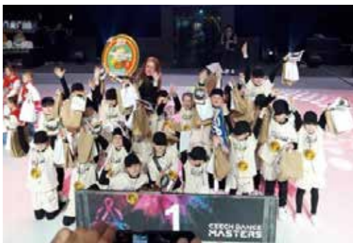
Mistrovství ČR, Czech dance masters.