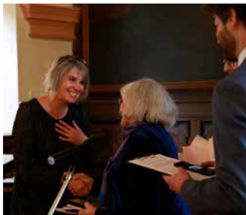
Převzetí ocenění.