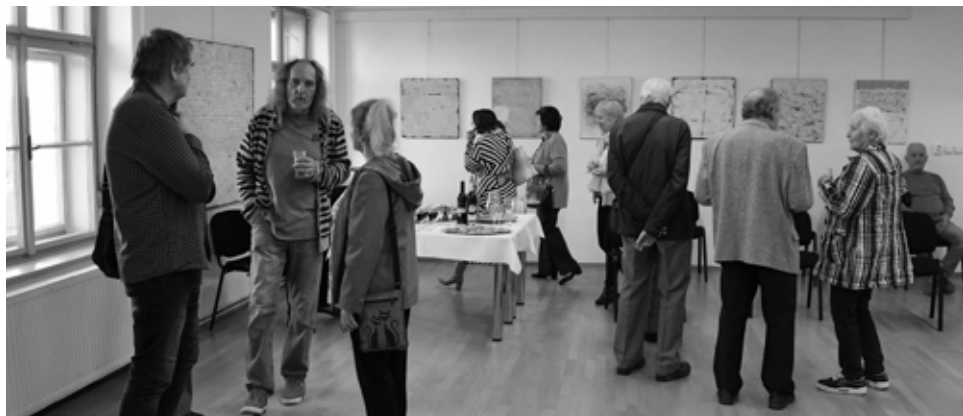
Z vernisáže.

Ve výstavní síni Klubu kultury na Masarykově náměstí 5 ve Velké Bíteši se uskutečnila v pondělí 15. května vernisáž výstavy obrazů Jana Svobody s názvem „ZNOVU A ZNOVU“.