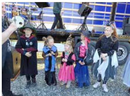
Oceněný čaroděj i čarodějnice.

dobily maminky s dětmi v Mateřském centru Bítešáček.