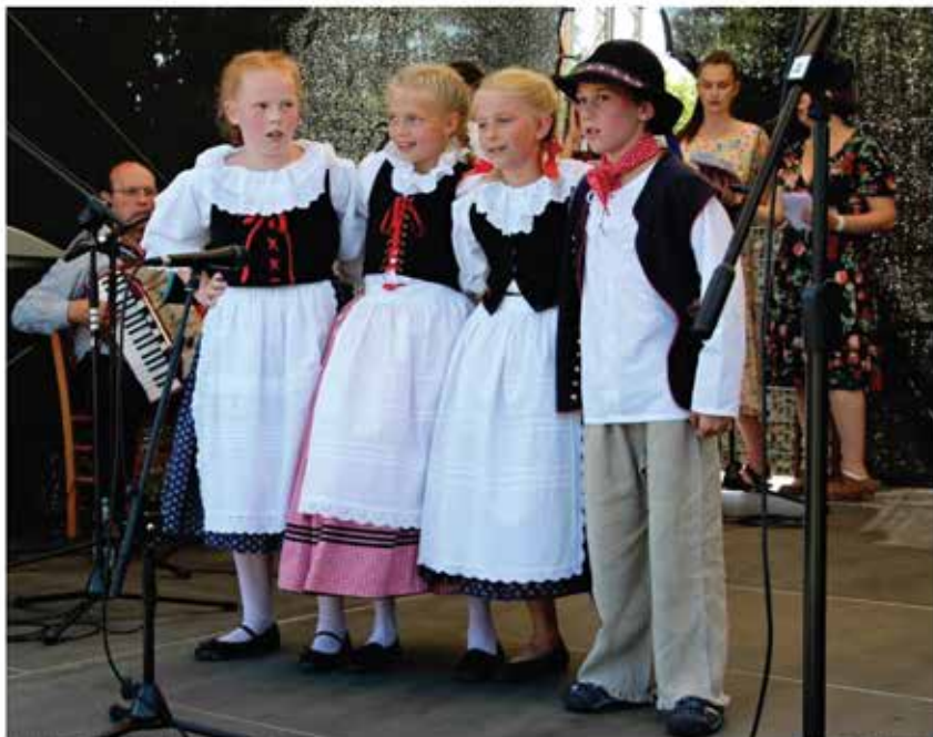
Národopisný soubor Bítešan – přípravnka, 2022