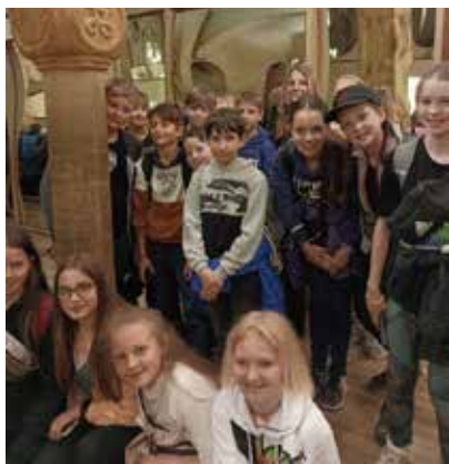
Pátáci v hlavním městě.

V pondělí 8. května, kdy si připomínáme Den vítězství, proběhla na náměstí ve Velké Bíteši zajímavá historická pietní akce.