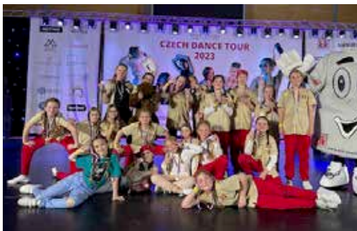
Mistrovství Moravy, Czech dance tour 2023.