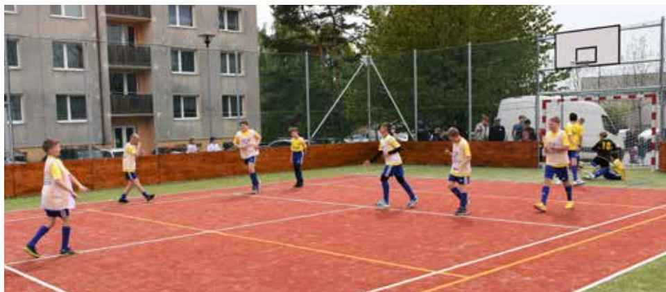
Tréninkové utkání mladších žáků FC PBS Velká Bíteš.