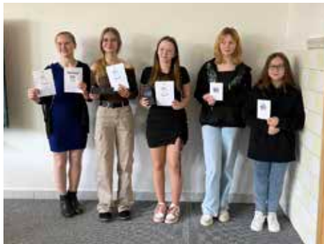
Okrskové kolo recitační soutěže.

Porota měla těžké rozhodování, soutěžících bylo více než dvě desítky. Předneseny byly básně českých klasiků, ale i modernější poezie. Opomenuti nebyli ani zahraniční autoři. Zastoupeny byly také texty prozaické. Výherci obdrželi dárkové poukazy na knihy, dále byly uděleny dvě „ceny útechy“ – sluchátka a značkové pero.