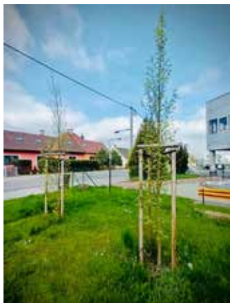
Habry 'Frans Fontaine' u obchodu na Vlčkovské ulici.

Vážení občané, rádi bychom vás informovali o výsadbách, kterými se podařilo obohatit městskou zeleň v uplynulém roce 2022.