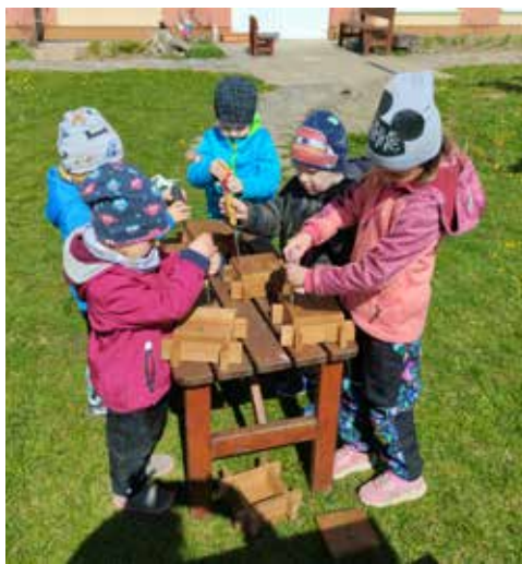
Sluníčka a projektový den u truhláře.

V pátek 28. 4. 2023 se ve třídě Sluníček uskutečnil projektový den s panem truhlářem , který začal ve třídě a pak pokračoval na školní zahradě. Ve třídě se znenadání mezi děti dostal zvláštní kámen z vesmíru – meteorit, když jej