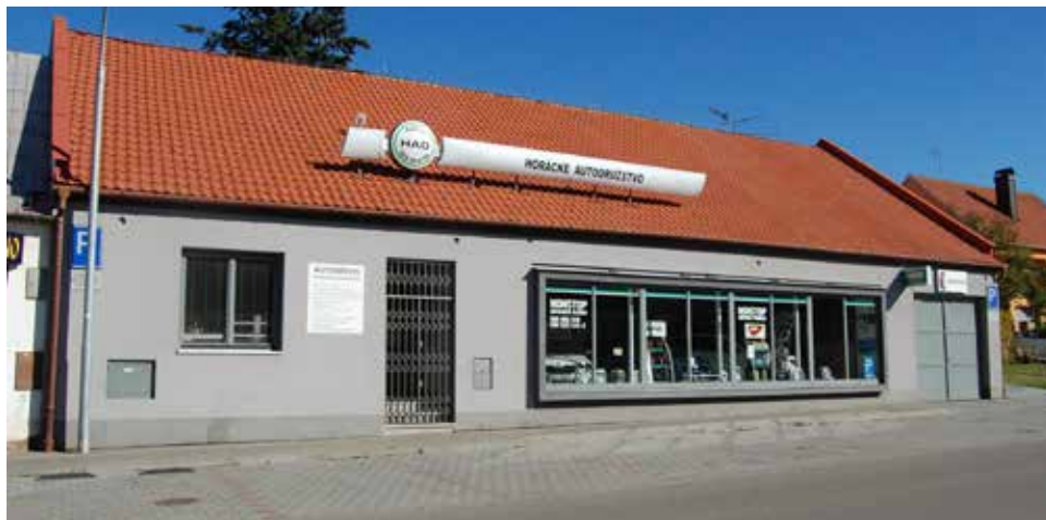
Dům čp. 60 v současnosti s provozem Horáckého autodružstva.