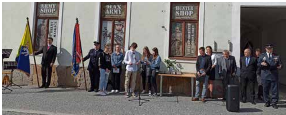
Z akce.

Zde žil Karel Fuchs, zavražděn 1942 v Osvětimi. To od květnového pondělí, výročí konce 2. světové války, říká kolemjdoucím jedna ze čtyř třeptivých destiček se jmény členů rodiny Fuchsových, které se objevily před domem čp. 86 na náměstí ve Velké Bíteši.