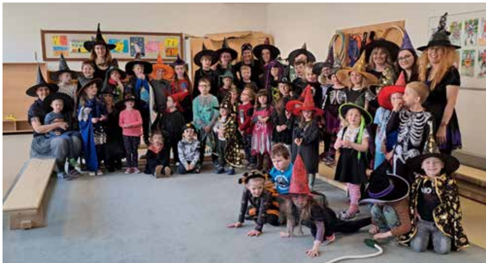
Čarodějnice v MŠ.

děti roztloukly kladívkem, tak v něm našly 2 semínka. Zjistily, že pochází z nějakého stromu. Postupně poznávaly různé jehličnaté i listnaté stromy, jejich listy či jehlice, květy, plody a strukturu dřeva. Poté se dozvěděly o cestě dřeva z lesa, přes pilu až do truhlářské dílny. Pak jsme se přesunuli na školní zahradu, kde byla u pracovního ponku ukázka nářadí a náčiní z minulosti i současnosti. Děti mohly vidět při akci starou ruční vrtačku nebo hoblík a pak také pozorovaly práci se současným elektrickým nářadím. Nakonec se děti rozdělily na skupinky do pěti stanovišť - sázení semínek, frotáž dřevěných struktur, zatloukání hřebíků, hoblování s broušením dílců dřevěného květináče a poslední stanoviště bylo u pana truhláře, kde děti kompletovaly dřevěný květináč – stloukáním stran a šroubováním dna. Pod dohledem si mohly vyzkoušet elektrické nářadí a jiné nástroje.