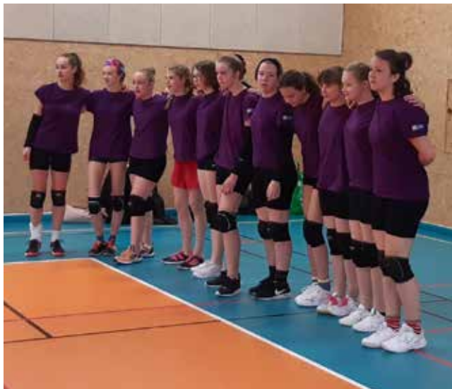
Bítešské volejbalistky.