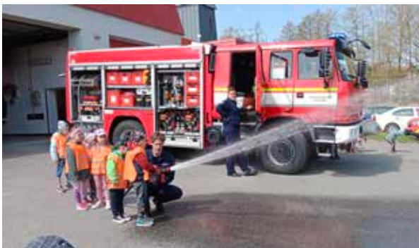
Berušky u hasičů.

Ve dnech 9. a 10. 5. 2023 jsme s dětmi navštívili hasičskou zbrojnici . Děti měly možnost si prohlédnout nejen hasičské auto, ale také celou hasičskou budovu. Seznámily se zázemím hasičů a s tím, jak vypadá jejich pracovní den. Viděly například, kde si hasiči předávají směnu, kde svačí, cvičí, kde mají možnost si odpočnout, kde se suší hadice i jakým způsobem se dozví o nutnosti výjezdu. Prohlédly si jejich vybavení a každý měl možnost zkusit si stříkat hasičskou hadicí. Hasičům za tuto zajímavou návštěvu moc děkujeme.