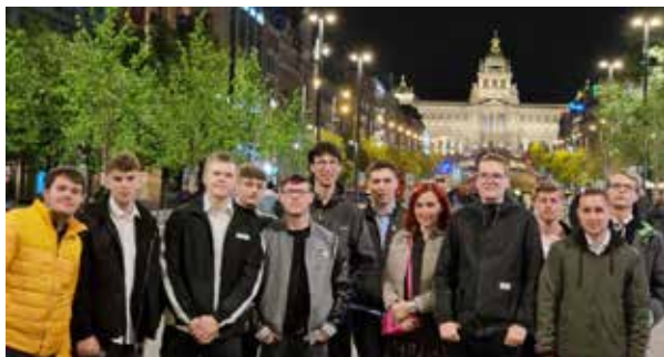
Návštěva Prahy.

Na konci dubna jsme se s třetím ročníkem mechaniků vydali na dvoudenní školní výlet do Prahy. První den jsme navštívili Národní muzeum, ve kterém jsme si prohlédli jednotlivé expozice z různých oblastí, jako je historie, příroda, věda a kultura. Poté jsme zamířili na Vítkov, kde jsme mohli obdivovat největší památník slavného husitského vojevůdce Jana Žižky. Odtud se nám naskytl nádherný výhled na celou Prahu.