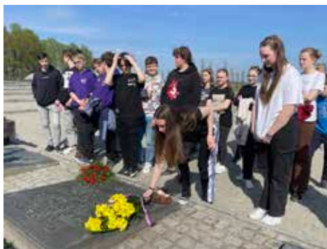
Exkurze do Osvětimi.

V letošním školním roce učitelé naší základní školy opět nabídli žákům devátých tříd exkurzi do polské Osvětimi a Březinky. Uskutečnila se v pátek 28. dubna. Po několikahodinové cestě autobusem mohli žáci projít s průvodcem oběma tábory. Mimo jiné také položili kytice u popraviště a památníku věnovanému českým obětem tábora. Hezké slunečné počasí, rozkvétající pampelišky a jarně zelené stromy nevyvolávaly depresivní náladu a bylo určité těžké představit si, kolik utrpení, ponížení