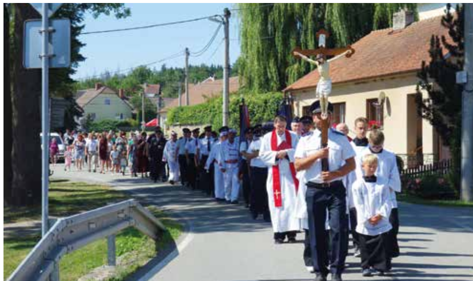
Průvod hasičů s rodáky na místní hřbitov.

Takto, v pohodě pokračoval odpolední program. Na parketě před velkým stanem, ve kterém se návštěvníci oddávali družné zábavě a užívali si bohatého občerstvení, předvedly svá vystoupení Pomponky z Osové Bítýšky a potvrdily svůj republikový věhlas.