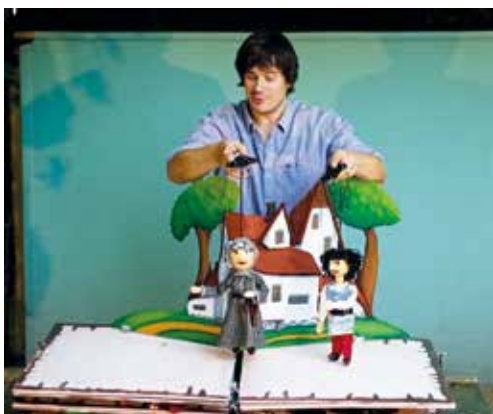
O princí z knížky.