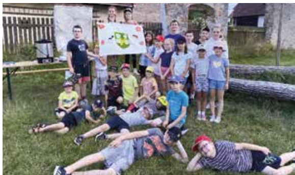
Mladší tábor.

daně. Naštěstí do království zavítali táborníci z Velké Bíteše. Seznámili se s Aničkou hrnčičkou, jejím tatínkem a tetou Libuší. Potom, co na vlastní kůži zažili neúprosné daňové zatížení, rozhodli se jim pomoci a navrátit tak do království spravedlnost a blahobyt.