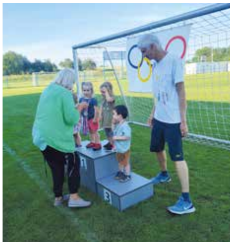
Dětská olympiáda.

her se vždy zúčastní děti v hojném počtu. Zahrají si fotbálek, vybíjenou nebo florbal, ale též pétanque a baseball. Velkým přáním této dvojice je vybudování dalších volnočasových sportovišť na Návřší nebo v Chobůtkách tak, aby děti měly více příležitostí ke sportování a pohybu i v těchto lokalitách.