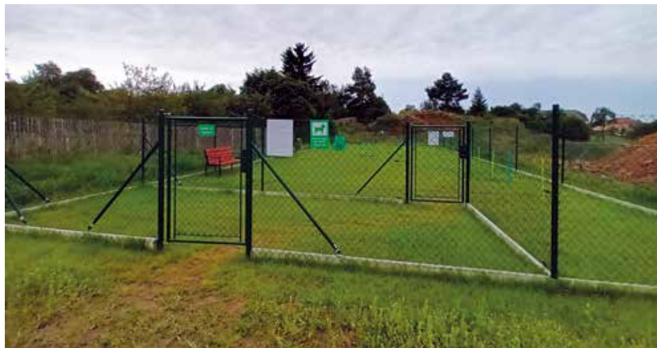
Nový prostor pro volný pohyb psů. | Foto: Archiv radnice

Vážení občané Velké Bíteše, rádi bychom vás informovali o otevření nového prostoru pro venčení psů v ulici Za Uličkami. Jedná se o oplocenou plochu vyhrazenou pro volný pohyb vašich psů. Zde můžete psa pod