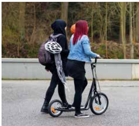
Terénní služby Wellmez.