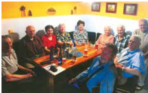
Společné foto.

Z fotografie vás zdraví spolužáci narození v roce 1936, dnes již 88mi-letí, kteří se sešli ve Velké Bíteši dne 21. 6. 2024. Ve znamení dvou nekonečno (88) jsme si popřáli hlavně hodně zdraví a také abychom v klidu a míru dožili dalších let.