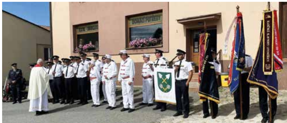
Slavnostní nástup heřmanovských hasičů před hasičským kaplanem.

Kdo chtěl, mohl se odpoledne přemístit „ke komínu“, kde na travnaté ploše proti OÚ byly připraveny ukázky požárního útoku s dobovými i historickými hasičskými stříkačkami. V akci byli nejen veteráni v historických uniformách, ale i jejich malí nástupci z místního zákovského družstva SDH. Bylo zajímavé sledovat, jaké potěšení způsobil proud vody z ruční koňské stříkačky těm, kteří se o něj svými pažemi zasloužili. Aktivitu projevili i někteří přihlížejíci.