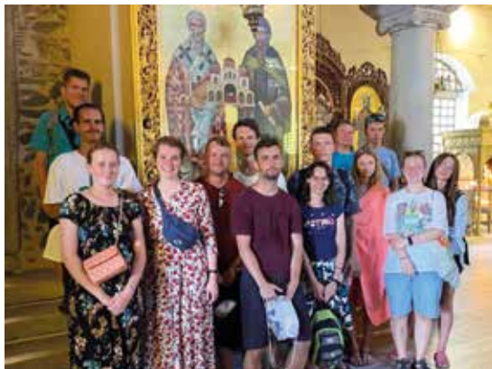
V Soluni u obrazu sv. Cyrila a Metoděje.