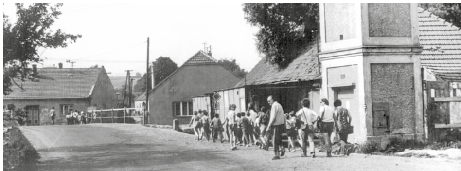
Snímek zachytil v roce 1971 náměšťský most, za ním bývalou hospodu (Janovice 65), uprostřed snímku štítem obrácený předmětný dům čp. 172 a vpravo u trafostanice Holíkovu kovárnu.

K obnově domu došlo teprve roku 1737, kdy městský úřad prodal „grunt Pindulovský pustý pod Špitálským rybníkem z jedné a blíž potoku u mostu strany druhé ležící“ v ceně 56 zlatých moravských provazníku Maxmiliánu Šanderovi . Mimo uvedenou částku náleželo 11,5 zlatých rýnských Voršile Suchánkové, která měla „po svých přátelích protendirovat“, a která si vymínila do obdržení té částky pobírat užitky z gruntu. Šandera obdržel lhůtu tři roky, během kterých z domu nemusel nic platit, aby jej vystavěl. Obci měl poté vyplatit 53 zlatých po vejruncích dvou zlatých a další tři zlaté ševcovskému cechu. Dle tereziánského katastru z roku 1749 nenáležely k domu žádné role, jen zahrada u domu (4 achtele).