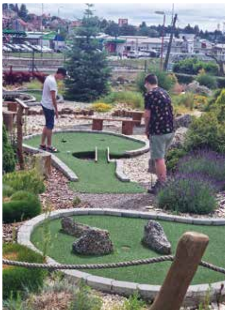
Minigolf ve Velkém Meziříčí.