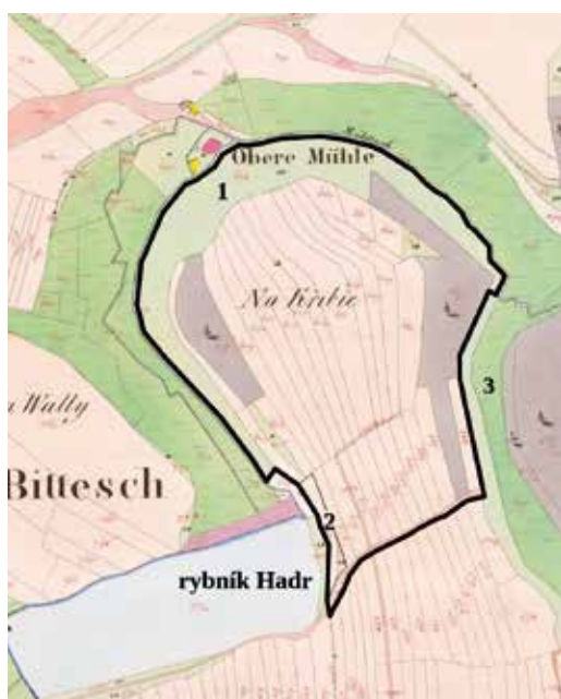
Trať „Na Křibě“ dle josefinského katastru v 18. století. Do mapy stabilního katastru z roku 1825 zakreslil autor.

Synonymy slova „chřib“ jsou pahorek, vrch, kopec. I dnes je předmětná trať při pohledu od bítešské zástavby podobně nápadná. Dokonce lze předpokládat, že pokud někoho ve 13. nebo 14. století napadla myšlenka na výstavbu opev-