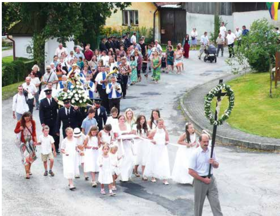
Pouťový průvod prochází kolem kapličky v Radňovsi.