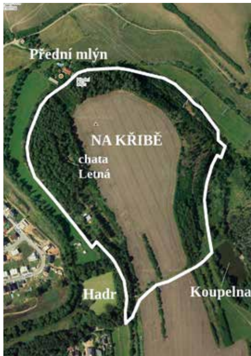
Josefínská trať „Na Křibě“ na satelitním snímku z roku 2022. Do snímku www.mapy.cz zakreslil autor.

něného hradu v Bíteši, zajisté musel zvažovat tento ostroh. O stabilitě názvu „Na Křibě“ svědčí nejen jeho užívání doložené již k první polovině 17. století, ale i jeho převzetí do stabilního katastru v roce 1825. Dnes název „Křib“ označuje v místě předmětné trati vrchol s kótou 496 metrů nad mořem, a to v širším území s pomístním názvem „Za Hadr“.