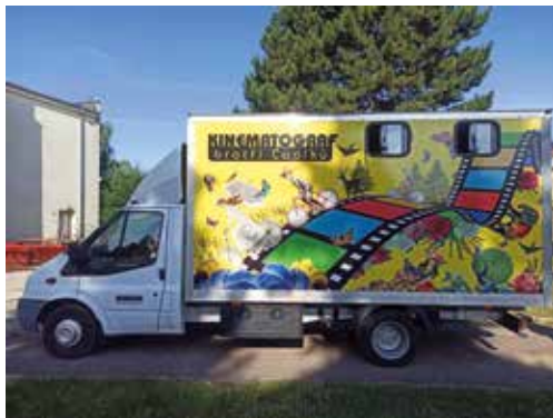
„Čadíci“ u kulturního domu.

V červenci do Velké Bíteše přijel opět Kinematograf bratří Čadíků. Na prostranství u kulturního domu se v úterý 23. července promítala romantická komedie o tom, co všechno se může stát, když se zapletete do jedné nevinné lži s názvem „Lítá v tom“. Ve středu 24. července to byl příběh „Nikdy neříkej nikdy“, který ukázal, že všechno zlé může být opravdu pro něco dobré a ve čtvrtek 25. července se nejen pro děti, ale i pro dospělé promítala pohádka „Princezna na hrášku“.