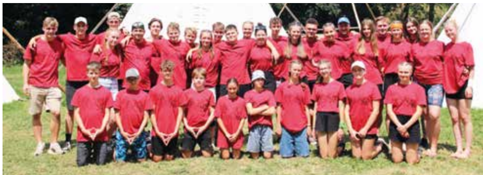
Starší tábor.