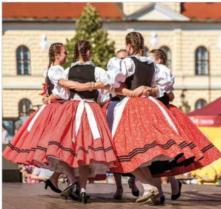
Setkání na Podhorácku 2023 – dívky z Bítešanu

Velká Bíteš, Masarykovo náměstí sobota 7. září 2024, začátek v 13:30 hodin