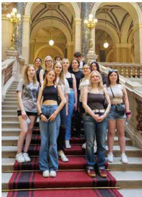
Výlet do Prahy.