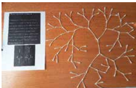
Fraktálový strom. | Foto: Archiv SOŠ J. Tiraye

Děkuji všem, kteří se zapojili a kterým jsem mohla tímto „tu hroznou matiku“ alespoň trochu zpříjemnit.