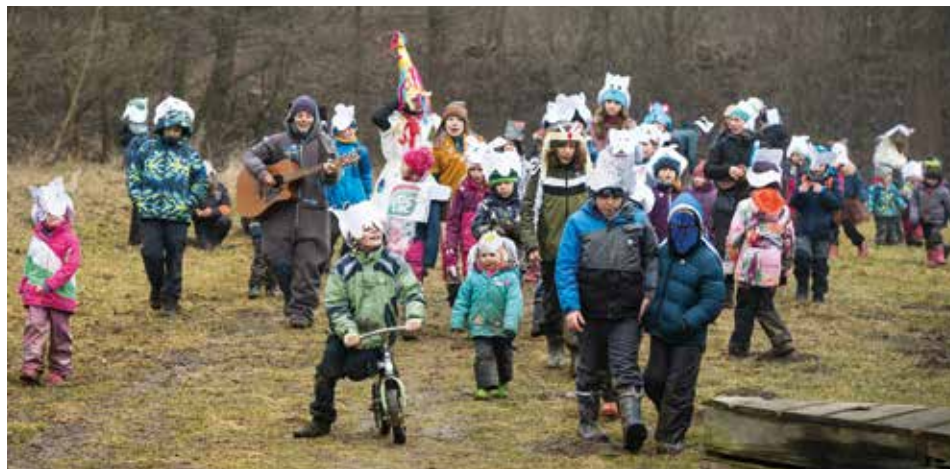
Masopustní průvod.

lesem a pomohli jim vyřešit úkoly spojené s poznáváním tradic. Vyráběly se jednoduché masky, nechyběl ani slavnostní průvod s kytarami kolem Pecky a závěrečný tanec s medvědem i laufrem. Co na tom, že bláta bylo po kotníky a v některých případech i po krk!