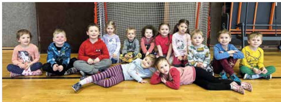
Cvičení v hale TJ Spartak. | Foto: Archiv MŠ

Ve středu 19. března, tedy v poslední zimní den, jsme se šli rozloučit se zimou. Děti ze Žluté třídy vyrobily krásnou Moranu, která je v lidových tradicích symbolem zimy. Moranu jsme společně vhodili do Bílého potoka u Předního mlýna. Moranu jsme vyprovodili říkankou „Zimo, zimo, táhni pryč“ a písničkou „Hřej, sluníčko, hřej. A hned následující den jsme přivítali jaro. Děti vyšly do ulic s krásnými papírovými květinami a kolemjdoucím je rozdávaly spolu s přáním krásného prvního jarního dne. Doufáme, že vás náš dáreček potěšil a aspoň trochu zpříjemnil den.