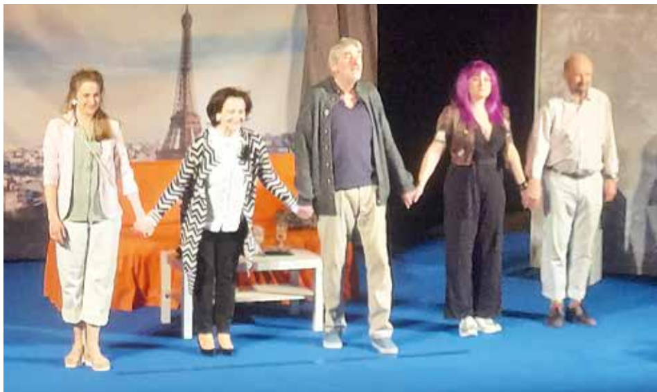
Na závěr představení.