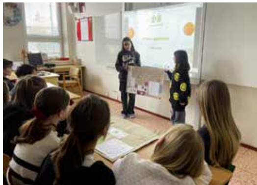
Projekt Kolik co stojí.

Vytvořené příběhy a návrhy bankovek měli příležitost předvést na společné prezentaci pro šestý ročník v rámci zakončení projektového týdne.