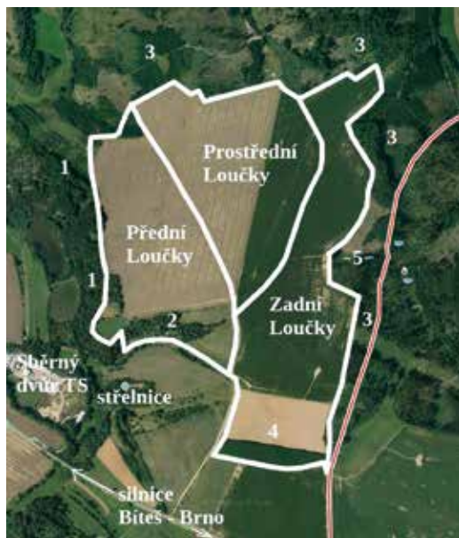
Josefinské tratě „Loučky“ na leteckém snímku z roku 2023. Do snímku www.mapy.cz zakreslil autor.

O loučském shromaždišti dobytka se doposud v literatuře nevědělo. Teprve rozbor josefinského katastru z roku 1787 je nyní odhalil a jeho výsledky budou dílčím způsobem představeny ve třech dílech tohoto seriálu. Popis loučského katastru zde začíná jeho méně exponovanou severní částí. Tu v josefinském katastru tvořila, kromě lesa, trojice polních tratí předměstí Růžová ulice s pořadovým číslem 10 až 12. Tyto tratě se nazývaly „Přední Loučky“, „Prostřední Loučky“ a „Zadní Loučky“. V poslední ze jmenovaných tratí se nacházelo městské pastvisko, které v Loučkách představovalo ústřední prostor.