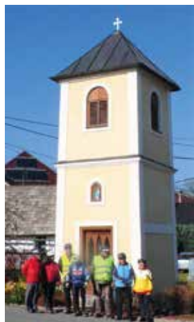
Ve které vesnici našeho regionu se nachází tato kaplička?