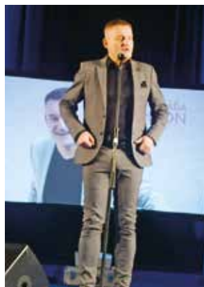
Z představení.