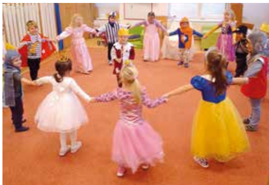
Hradní slavnost.