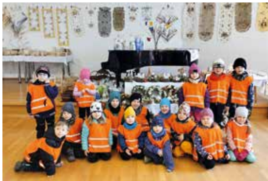
Návštěva Velikonoční výstavy.

Ve čtvrtek 20. března za námi přijelo maňáskové divadlo Šternberk s pásmem tří pohádek – O šípkové Růžence, O pejskovi a kočičce a Liška, zajíc a kohout.