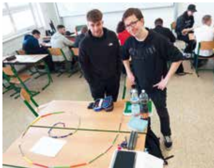
Mezinárodní den matematiky.