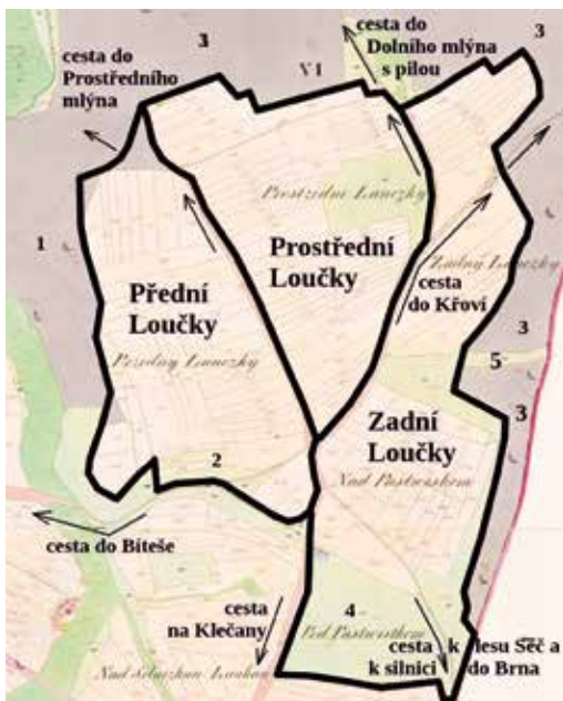
Trojice tratí „Loučky“ dle josefinského katastru v 18. století. Do mapy stabilního katastru z roku 1825 zakreslil autor.

Jak napovídá samotný název vsi, Loučky sloužily snad již od svého založení jako shromaždiště hovězího dobytka při jeho přesunech zejména z Uher do Čech a dále na západ. Právě sem mířila ve směru od Zbraslavi tzv. Uherská cesta, kterou uvedl do literatury Rostislav Vermouzek v roce 1992. Vedla přes Lanžhot do Hustopečí, kde probíhaly pravidelné trhy s uherským dobytkem a byl vybírán třicátek, a do Čech přecházela u Polné. Mezitím se u Bíteše potkávala s cestou od Brněnska a větvila se do dalších směrů do Čech, zejména na Žďársko a asi s menší intenzitou na sever na Bystřicko. Transfery uherského skotu západním směrem přes Bítešsko probíhaly možná již ve 13. století, doložené od 14. do 18. století. Uvedený přísun dobytka zajisté představoval zásadní zdroj pro bítešské řezníky, asi i proto tu bývalo hovězí maso hlavním druhem masa.