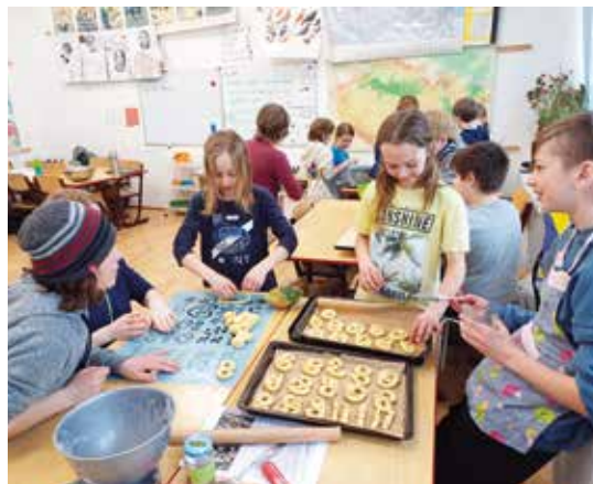
Příprava preclíků.

Aktivní byly nejen lípové děti, ale i velcí. Budoucí zájemci si přišli pro informace,