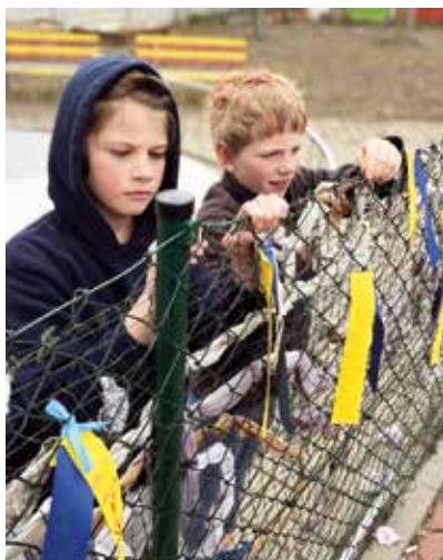
Přání po větru poslaná.

Děti nelze z debaty vynechat. Válka se netýká jen dospělých. Děti vnímají, že teď pomocí nemohou. Snad v budoucnu, jestliže se zorientují v lidských hodnotách a budou umět kriticky hodnotit informace. Dnes potřebují po svém pochopit, co se ve světě kolem děje. Co se děje jejich vrstevníkům. Mohou na plot napsat dětský vzkaz a poslat ho symbolicky po větru, ať se to komu líbí či ne. Jsme vděční za klid, který tu máme, a přejeme ho všem.