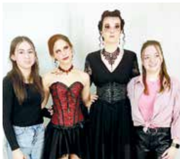
Kadeřnická soutěž.

Žákyně 2. ročníku oboru Kadeřník měly možnost se účastnit kadeřnické soutěže Look a Style v Prostějově. Ta byla zaměřena na téma Vampire a konala se dne 13. 4. 2025. Všichni žáci měli na zpracování daného tématu 55 minut.