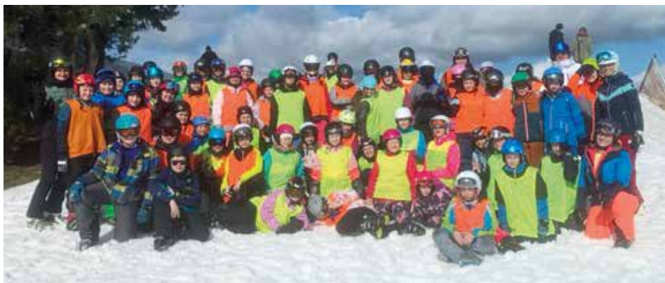
Lyžařský kurz.

Na konci února se uskutečnil druhý lyžařský kurz. Tentokrát pro žáky pátého ročníku, které doplnili někteří sedmáci. Téměř jarní termín zajistil krásné počasí a prázdnou sjezdovku na Fajtově kopci. Celotýdenní lyžování bylo zakončeno závodem ve slalomu.