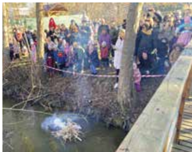
Vynášení Morény.

V druhém týdnu se již všechny děti vrátily do svých tříd. V rámci integrovaných bloků jsme se vydali na Jarní výpravu, během které jsme nejen objevovali krásy probouzející se přírody,