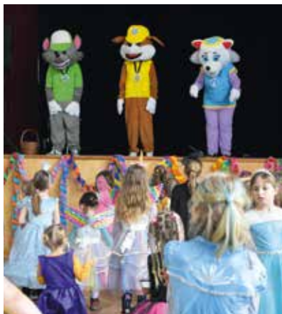
Z karnevalu.

V sobotu 8. března jsme v kulturním domě ve Velké Bíteši pro děti uspořádali dětský karneval, tentokrát s Tlapkovou patrolou & Ledovým královstvím. Děti a rodiče si užili sobotní odpoledne plné zábavy, tance, písniček a soutěží. Opět se nám tu sešlo spoustu různorodých kostýmů a masek, ve kterých jsme mohli vidět piráty, rytíře, indiány, čaroděje a nespočet princezen. Pro malé návštěvníky byla připravena bohatá tombola. Děti v ní mohly vyhrát nejen různé sladkosti, ale i hračky nebo knížky. Součástí karnevalu bylo také oblíbené malování na obličej. Všem moc děkujeme za účast.