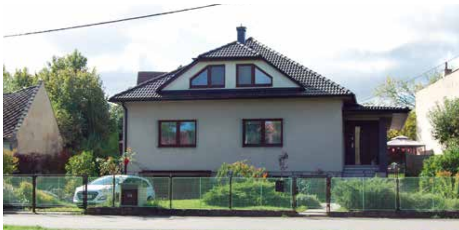
Dům čp. 180 a za ním skrytý dům čp. 172 v současnosti.