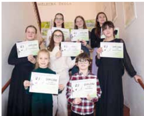
Soutěž ve zpěvu.

Ve čtvrtek 27. února 2025 se na Základní umělecké škole ve Velké Bíteši konalo okresní kolo soutěže ZUŠ v sólovém a komorním zpěvu. Z celkového počtu 48 soutěžících naši školu reprezentovalo v různých kategoriích celkem osm zpěváků, kteří, i přes velkou konkurenci, obsadili krásná první a druhá místa. Velký dík patří nejen všem pedagogům, kteří své žáky připravili, ale také všem, kteří se na organizaci této soutěže podíleli. Soutěžilo se také v okresním kole