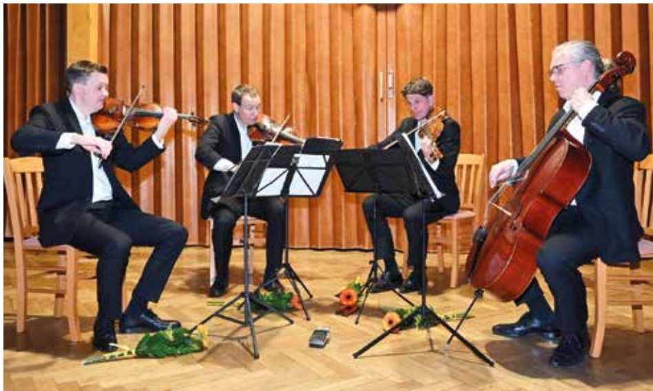
Z koncertu.